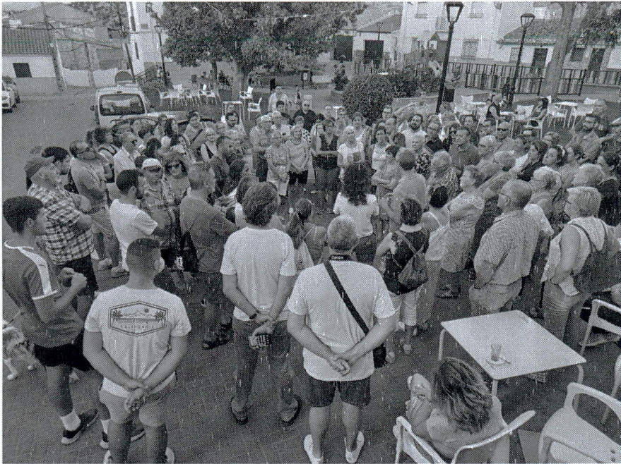
Sobre la horca.