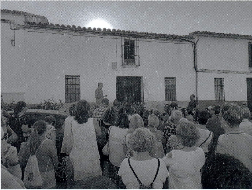
Fachadas de tipología villanovense.