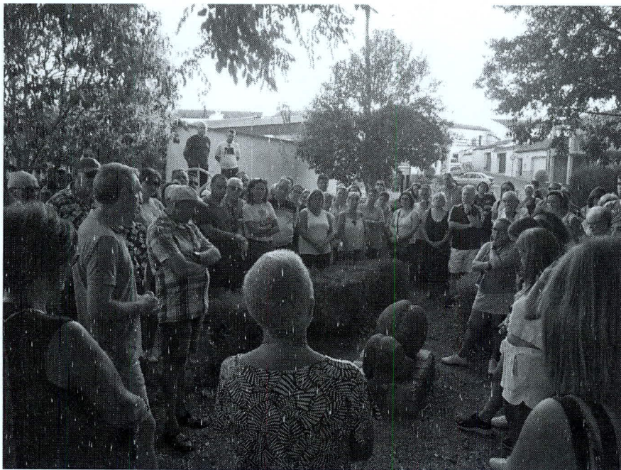
Ante las vulvas de Miraflores.