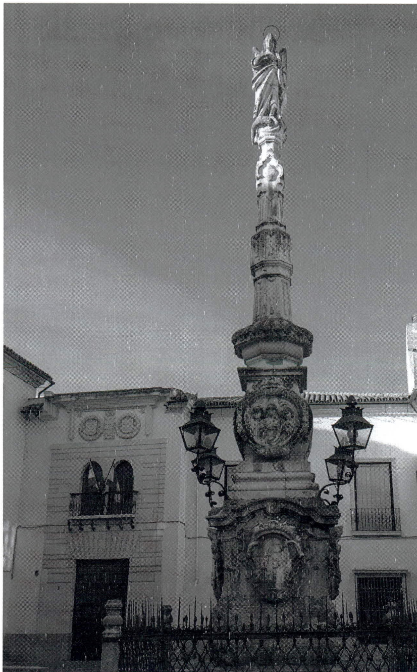
Fig.2.-Triunfo de San Rafael con casa de los condes de Hornachuelos al fondo.