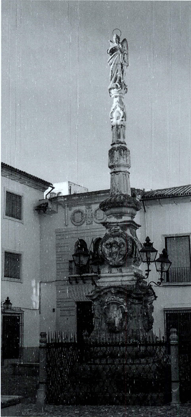
Fig.1.-Alonso Gómez Sandoval. Triunfo de San Rafael en Plaza de Aguayos.