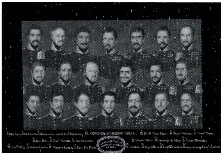
Imagen de los alabarderos que defendieron el Palacio al mando del Coronel D. Domingo Dulce que fue ascendido a General por Espartero.