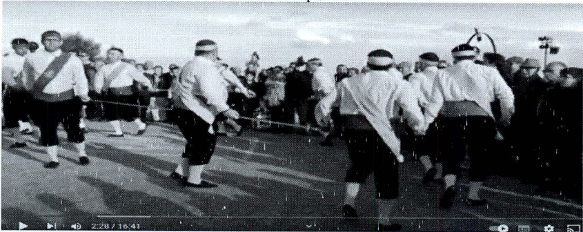
F. N.º 8 Corro

Mudanza 5ª o reverencia. - Siguiendo con la mudanza 2ª o dos columnas en zig zag, y moviéndose con su característico paso, los danzantes avanzan hasta estar delante del tamborilero-flautista (Foto n.º 9). Siguen varios compases, siempre desplazándose de izquierda a derecha, pero sin avanzar, y en un momento determinado señalado por el guía, todos los danzantes se arrodillan con la pierna derecha posada en tierra y la izquierda en ángulo recto (Foto n.º 10). Se levantan y dan la danza por terminada.