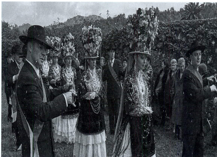
F. N.º 14. Los sombreros de las madames

En la danza de Bayona se realiza las mudanzas 1ª y 2ª. En la 1ª realizan líneas serpenteantes libres, sin pasar por ningún tipo de arco como en el Andévalo.