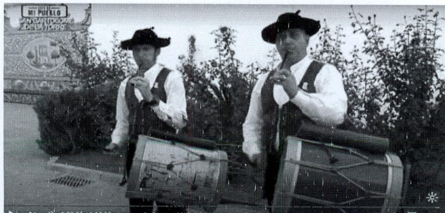
San Bartolomé: Flautistas-tamborileros