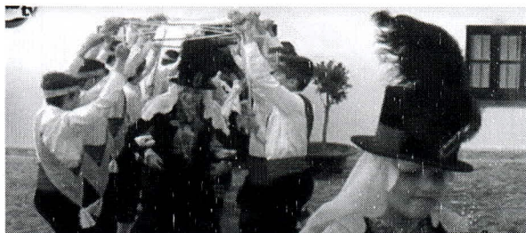
F. n.º 4. Arco: paso de las mayordomías

enfrente de la otra, mirándose los danzantes y con las espadas levantadas formando una bóveda con el fin de que pasen por debajo de ésta las madames (foto n.º 4), autoridades eclesiásticas y civiles, miembros de la hermandad, mayordomos (foto n.º 5), etc.