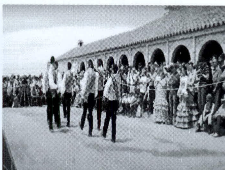
Cerro Andévalo: Mudanza del ocho