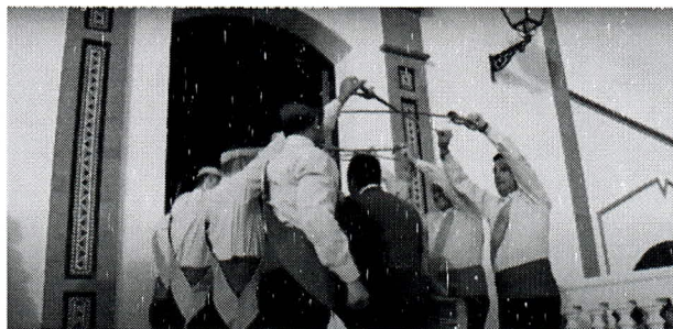
F. n.º 5. Arco: paso mayordomos

Mudanza 3ª : Culebra o serpiente o paso por arcos múltiples. -Se parte de la columna de uno, tras intercalarse los danzantes en la mudanza 2ª, saliendo con las espadas en alto formando una serie de arcos uno tras otro: 1º-2º, 2º-3º, 3º-4º, 4º-5º, etc.