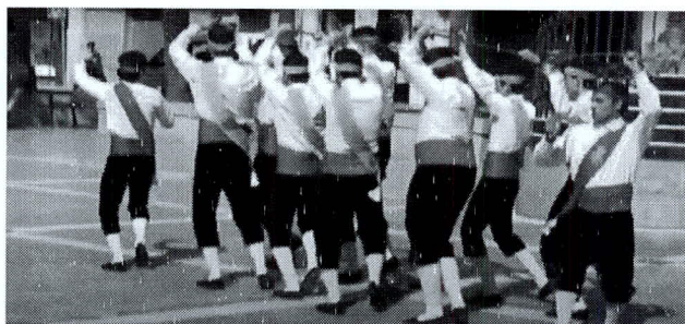
F. n.º 3. Abrenes

Posteriormente, hacen una variante de esta llamada vuelta atrás o cambio de posición de las columnas y al que denominan arco coreográfico o abrenes , que consiste en que el 1° gira a su derecha 90° y el 2° otros 90° a la izquierda poniéndose uno frente a otro y levantando ambos los brazos izquierdos, giran otros 90° poniéndose el 1° en el sitio del 2° y éste en el del 1°. El 3° hace igual movimiento, colocándose detrás del 1°, el 4° detrás del 2° y así sucesivamente, pasando por los diferentes arcos, con lo que se consigue la posición de partida de la mudanza (foto n.º 3).