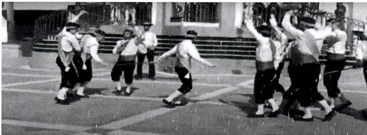
F. n.º 6. Culebra

El guía gira 180º levantando su brazo izquierdo y, por tanto, su espada, poniéndose de cara al 2º, pasa por bajo de su espada, arco 1º-2º, a continuación por bajo del 2º-3º, mientras el 2º pasa por el 2º-3º. El guía sigue pasando por el 3º-4º, 4º-5º, 5º-6º, 6º-7º, 7º-8º, 8º-9º y 9º-10º, el 2º por 3º-4º, 4º-5º, y así sucesivamente hasta el rabero, que pasa por el 10º-11º. Van pasando a un lado y otro de la columna, describiendo un movimiento serpenteante o el de una serpiente al pasar por los diferentes arcos (foto n.º 6) hasta el final de la mudanza. El n.º 11 arrastra su espada por el suelo, marcando el movimiento serpenteante como si se tratase de la cola de una culebra. Salen en columna de a uno.