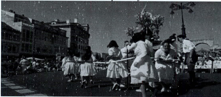
F. N.º 12: San Miguel. Por debajo de las andas

Los sombreros que llevan las mayordomías en la romería, foto n.º 13, tal vez se influenciaron a los usados por las “madamás” de Villaboa (Pontevedra). Foto n.º 14.