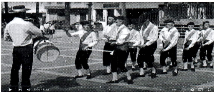
F. n.º 9. Avance hacía tamborilero