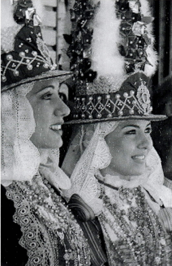
F. N.º 13. Mayordomías

En Andalucía, siguiendo a Lopez Martinez 11 , los hombres eran contratados especialmente para trabajar a destajo en las faenas agrícolas de la siega y vendimia y, posteriormente, desde mediados del siglo XIX en la minería. Por la documentación existente en los archivos de las minas de Río Tinto entre 1873 y 1923, trabajaron en éstas 1160 gallegos y 2260 hasta 1940, correspondiendo un 63% a los originarios de Orense. Se desplazaban en grupo, la mayoría jóvenes entre 20 y 35 años. En las minas formaban cuadrillas a cargo de un contratista que firmaba con la empresa el contrato conseguido en subasta a la baja, una forma como cualquier otra para la explotación de las minas al mínimo coste.