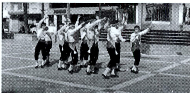
F. n.º 2. Dos columnas

izquierda, encogiendo la pierna derecha y apoyándose en ella. Levantando la pierna izquierda da un saltito a la izquierda y, apoyándose en el izquierdo, encoge esta pierna y avanza con salto. El guía gira 180° a su derecha, levantando al mismo tiempo su brazo izquierdo y, por tanto, su espada y el 2° al tenerle la punta cogida levanta su brazo derecho girando 180° a su izquierda. Al terminar estos movimientos, han formado un arco, 1°-2°, y dan la cara al resto de los danzantes. El 1° y 2° avanzan, con lo que éste último tiene que tirar de su espada, lo que hace que el 3° avance pasando por bajo del arco 1°-2° y de la espada del 2° y de su propia espada y girando a su derecha se coloca detrás del guía. El 4° hace lo mismo y girando a la izquierda se coloca detrás del 3° y así sucesivamente hasta el rabeda, que se coloca en la columna del 1° tras pasar por los arcos correspondientes, 1°-2°, 2°-3°, 3°-4°, etc.. Se han formado dos columnas, una de 6 danzantes con los impares encabezada por el guía y otra de 5 con los pares encabezada por el 2°. Ambas columnas están enlazadas por las espadas dispuestas en zig zag llevadas a la altura de la cintura o en alto, en este último caso formando una bóveda y todos mirando al lado contrario a como comenzaron. Foto n.º 2.