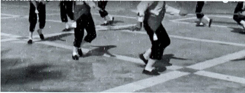
F. n.º 7. Cesión de la espada del n.º 11 al 1º

En un momento marcado por el guía, éste y el rabera elevan sus brazos derechos y con ello la espada que les une formando un arco elevado. El guía se gira pasando por bajo del arco 1º-11º, mientras que el 11º sigue al 10º. El 2º pasa bajo el arco 1º-11º, al tiempo que el 1º tira del 2º, formando el arco 1º-2º. El 2º tira del 3º que pasa por los arcos 1º-11º y el 1º-2º, al avanzar el 1º y 11º, y así sucesivamente, ordenándose uno detrás del otro. Al final, el 1º suelta la espada del 11º, dando comienzo a la mudanza 2ª, manteniéndose los danzantes en el sitio.