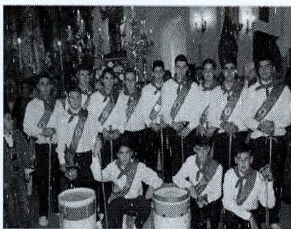
Danzantes de Alosno

Otras conclusiones que se sacan, hasta ahora, sobre su evolución, es que, por una parte, desde las últimas décadas del siglo XIX hasta la décadas del 50 y 60 del XX, solo se hacían las dos primeras mudanzas y por otra parte que, posteriormente, se añadieron las demás mudanzas o, alguna de ellas se recuperó al estar perdida. Tal vez los motivos los indica Delgado Méndez 18 al describirnos que :''la danza se vincula con el colectivo de pastores de una parte del Andévalo'' y que ''la deestructuración que provocó la emigración y el abandono del campo de los años 60 y 70 (del siglo XX), junto a la escasa relevancia de la danza en las poblaciones donde había algún grupo, provoca la desaparición de algunas. Se empezaron a recobrar en las décadas de los 80 y 90.'' Consideramos que las danzas de la región de Andévalo están directamente vinculadas a ciertas danzas gallegas y aragonesas.