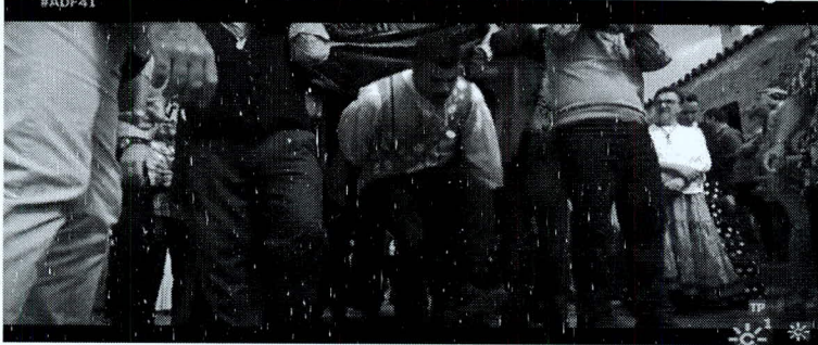
F. N.º 11. San Benito por debajo de las andas

El inicio de la danza de San Benito de Cerro Andévalo se realiza pasando los 7 danzantes por debajo de las andas del Santo, foto n.º 11, al igual que se hace en las de Marín, foto n.º 12, por debajo de las que llevan a San Miguel.