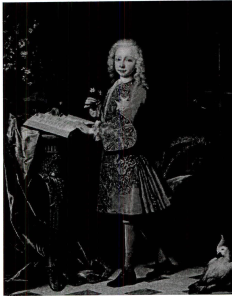
Carlos III con 10 años. Cuadro de Jean Ranc.

El día señalado se celebraron actos religiosos y festivos, corridas de caballerías, y toros; así como juegos y diversiones que ensalzaban la corona. Espectáculos de distracción y júbilo como eficaz medio de persuasión, atrayendo los sentidos de los vecinos para mentalizarlos en la fidelidad y continuidad de la monarquía.