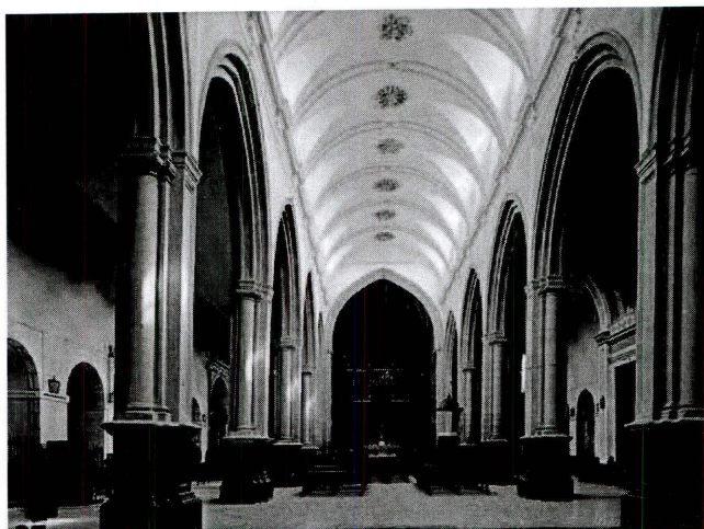
Interior de la iglesia de la Asunción de Bujalance.

policromados y otras composiciones simbólicas, numerosas hachas, cirios y velas, ornamentos sagrados, el coro musical, el sermón encargado al efecto y el riguroso cortejo fúnebre siguiendo una estricta normativa de protocolo, dotaban al acto de una gran magnificencia. Durante dos días se formó un espectáculo que cantaba el triunfo ultraterreno del monarca.