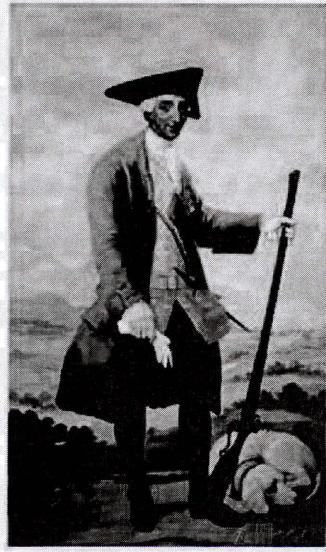
Carlos III retratado por Francisco de Goya.

las virtudes del finado. Todo ello ante la exaltación que suponía el túmulo construido al efecto, monumento funerario que era un importante medio de propaganda política y religiosa de la realeza absolutista, que aprovechaba este arte efímero circunstancial como medio de persuasión, atrayendo los sentidos del espectador hacia los contenidos programáticos del poder, escenificando y ratificando una vez más la continuidad monárquica por encima del cambio de rey, para ello desplegaban todos los símbolos ideológicos de reafirmación y fidelidad colectiva a la monarquía.