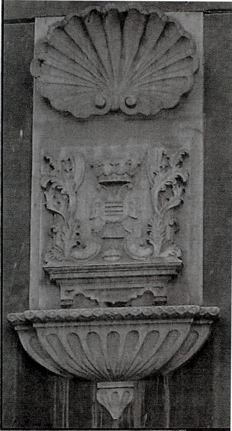
Escudo de la Mayordomía Ducal.