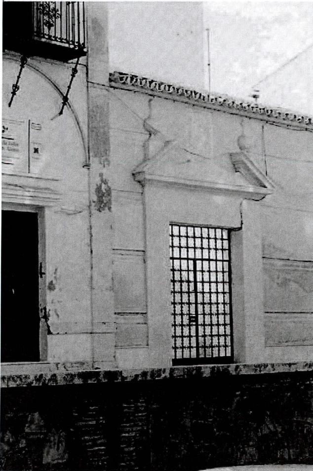
Convento de los Frailes.