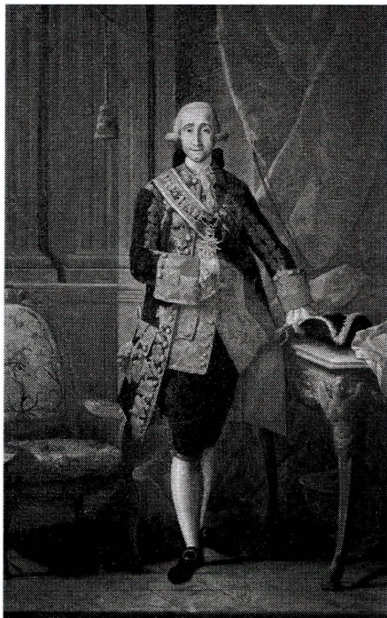
Pedro de Alcántara de Silva Fernández de Híjar IX duque de Híjar y X conde de Palma. Antonio González Velázquez, 1774. Sevilla, Palacio de las Dueñas.

de Palma. Este último en virtud de sentencia dictada a su favor por el Consejo de Castilla, a 7 de mayo de 1761, por la que se dispone la integración del Condado de Palma —con su Grandeza anexa— en la Casa de Híjar, quedando incorporados a ésta los títulos, bienes y mayorazgos de Palma, Almenara y Montesclaros-Castildebayuela, «vacantes por muerte del cardenal Joaquín Portocarrero». 14