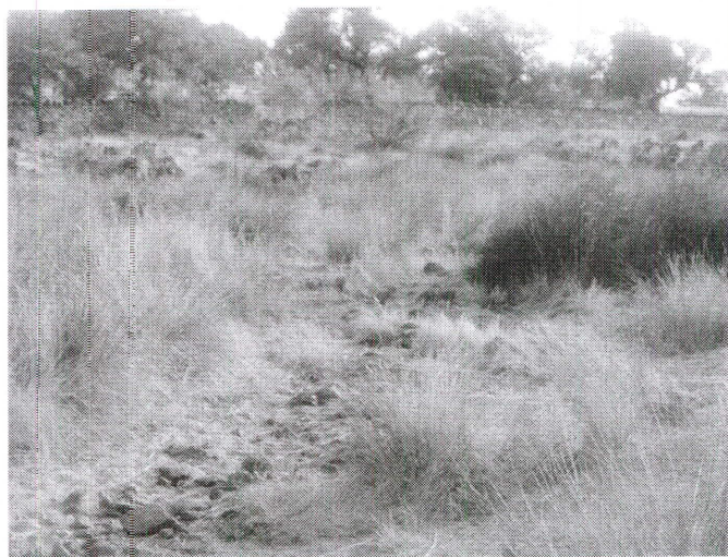
Márgenes del arroyo Santa María, lugar donde se depositaban cadáveres de animales.