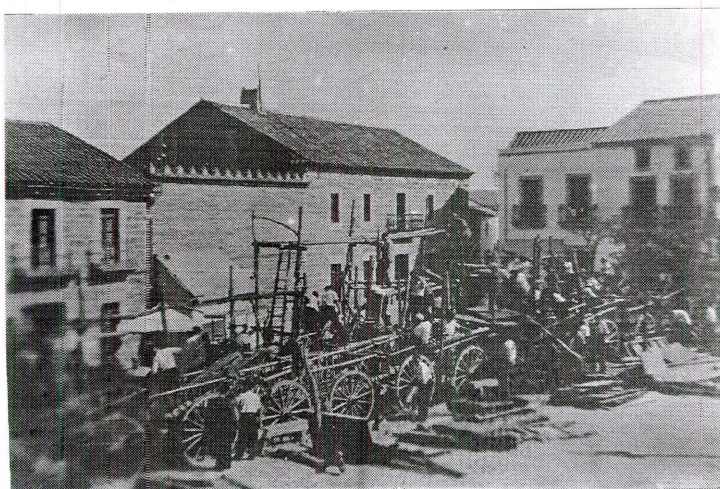
Preparación de la plaza para un espectáculo taurino.