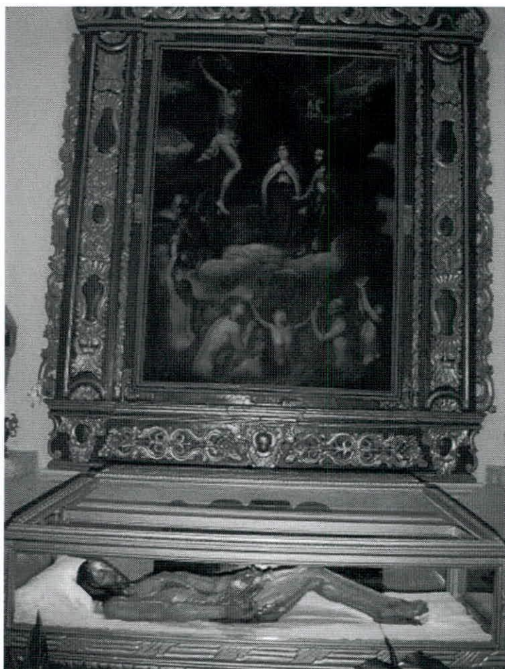
Cristo Yacente ante el cuadro de las Ánimas.

La Cofradía de San Sebastián era la más antigua de la Villa, que se fusionará en la segunda mitad del S.XVI con la de Ánimas Benditas tras el Concilio de Trento (1569). El cuadro con muchas posibilidades puede ser de 1672, fecha en que aparece la adquisición del marco en las cuentas de la Cofradía de Ánimas.