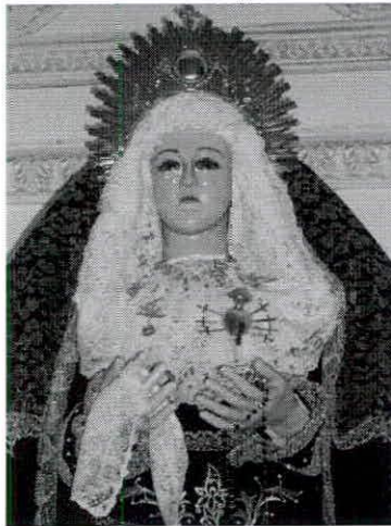
Imagen de Ntra. Sra. de los Dolores del siglo XVIII.

La Cofradía de la Soledad de Zuheros, debió crearse poco antes de la segunda mitad del siglo XVIII dado que sus primeras propiedades aparecen en la relación del Catastro de Ensenada (1752) y nada sabemos de ella con anterioridad. Podríamos dar por válida como fecha de fundación el año de 1728. Lo razonamos de la siguiente