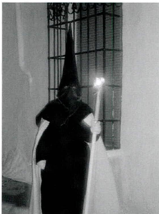
Hermano de la actual Cofrada de la Virgen de los Dolores antigua de la Soledad.