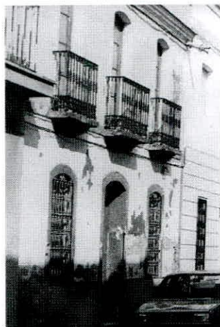
Casa del Pueblo republicana

“Las instrucciones para la huelga” que pondrían en marcha esta revolución democrática fueron redactadas por el comité de Huelga de la UGT y difundidas el día 12. En sus tres puntos se trataban de la paralización de todos los trabajos tras recibirse la orden procurando atraer al mayor número de trabajadores; la no iniciación de hostilidades por parte de los trabajadores y el recordatorio a las fuerzas armadas que eran parte del pueblo y, finalmente, no cesar el movimiento hasta conseguir los objetivos propuestos y recibirse órdenes concretas de los comités nacionales de UGT y del PSOE. Este llamamiento no estaba firmado por los republicanos, que no se comprometían públicamente. 53