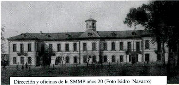
Dirección y oficinas de la SMMP años 20

Aunque no se ha podido comprobar como causa-efecto, algunos de los mayores peñarriblenses consideraban que el traslado de la dirección de la SMMP en España desde Pueblonuevo, al frente de cuyos negocios quedaba el subdirector José