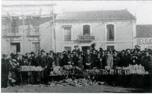
Reparto de juguetes el día de Reyes de 1917.