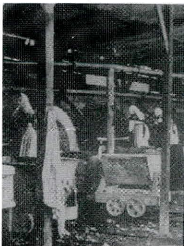
Trabajadoras de la Sociedad de Peñarroya

dirección patronal, que explicó su negativa a ceder a las peticiones obreras. Luego la comisión obrera y el alcalde se reunieron con el director para hacerle saber sus peticiones y este aceptó dar a los ferroviarios iguales beneficios que los mineros obtuvieron en julio, lo que fue considerado insuficiente provocando discrepancias entre los comisionados que mantuvieron la declaración de huelga, que llevaron con espíritu de transigencia a la reunión celebrada con el gobernador esa misma tarde, previa a la conjunta entre ambas partes, en la que el gobernador hizo una nueva propuesta de cesiones al director e ingenieros y a los obreros, que tras ser consultadas con los sindicatos telegráficamente, les permitió volver a reunirse y tras discutir algunos puntos, firmar el acta de la solución del conflicto a las dos de la madrugada del día 9, con un acuerdo que consideraba, además del