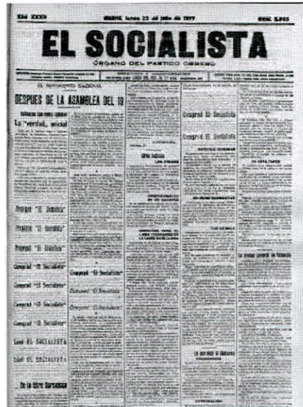
Portada de El Socialista 23-7-17censurada

En este mes de julio se producen dos acontecimientos básicos para entender el estallido de la crisis de 1917 en España: la celebración de la Asamblea Nacional de Parlamentarios en Barcelona, donde el 19 se reunieron de una manera rocambolesca,