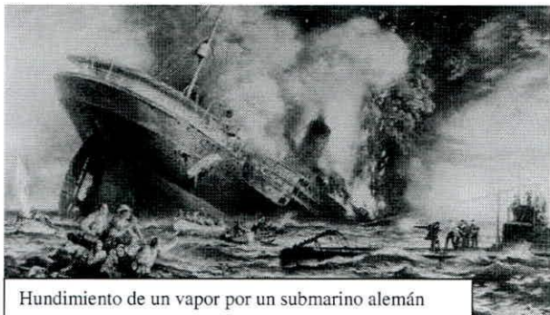
Hundimiento de un vapor por un submarino alemán

suerte de sindicatos militares- a la que se unió la producida tras el hundimiento del vapor San Fulgencio por un submarino alemán- y que García Prieto presentó como una muestra de buena voluntad del nuevo gabinete 23 .