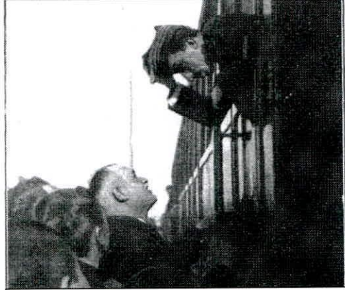
F 4 Alfonso XIII conversa con el alcalde terriblense.

En el mes de marzo el temporal de lluvias que se vive en Andalucía produce inundaciones y destrozos en Jaén, Córdoba, Sevilla y Cádiz y llega a interrumpir las comunicaciones ferroviarias con Madrid, por ello el viaje del rey Alfonso XII a estas dos últimas ciudades se hubo de hacer atravesando el Valle del Guadiato, por las líneas del Madrid-Zaragoza y Alicante, entre Almorchón y Belmez, y la de los Ferrocarriles Andaluces, entre Belmez y Córdoba. El tren real se detuvo unos minutos en las estaciones de Peñarroya atendiendo a la solicitud realizada al presidente del Consejo de Ministros, Álvaro de Figueroa -conde de Romanones y uno de los accionistas principales de la SMMP- y al Mayordomo mayor de Palacio «suplicando en nombre del vecindario de esta villa