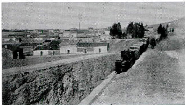
Tren en la trinchera de salida del FFCC métrico desde la estación de Pueblonuevo del Terrible.