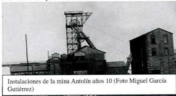
Instalaciones de la mina Antolín años 10

concentraron fuerzas de la guardia civil para asegurar el orden y el derecho al trabajo llegadas al mando del teniente coronel Álvarez desde Córdoba por ferrocarril en el tren de la tarde el domingo 10, en Puelblonuevo del Terrible y desde el potente sindicato minero asturiano se ofrecieron hasta un millón y medio de pesetas, según exageraba alguna prensa, para mantener la resistencia de los huelguistas, a los que iban a sumarse los de Espiel y los de la cuenca hermana de Puertollano (Ciudad Real) -lo que hubiera agravado considerablemente el conflicto al afectar a más de 12000 trabajadores- .