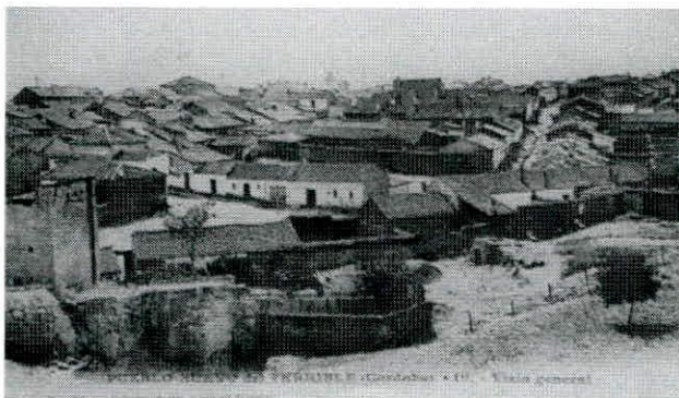
Vista parcial de Pueblonuevo del Terrible.