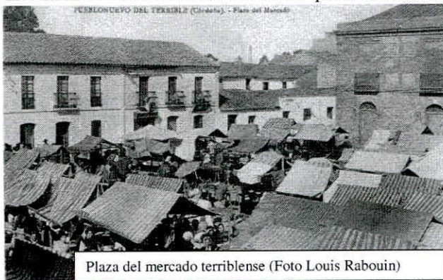
Plaza del mercado terriblese

El Gobernador civil negaba la falsedad de los infundios interesados que se habían difundido sobre la situación en Pueblonuevo, con el que estaba en comunicación telegráfica permanente y confirmaba la absoluta normalidad que allí se vive informando, además,