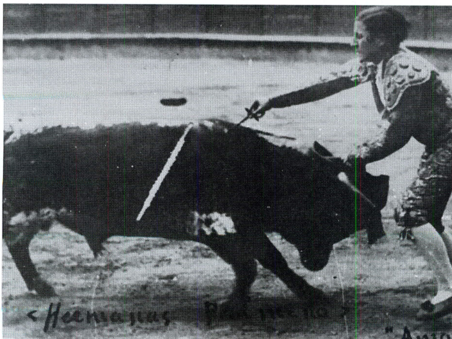
Amalia ejecutando la suerte suprema.