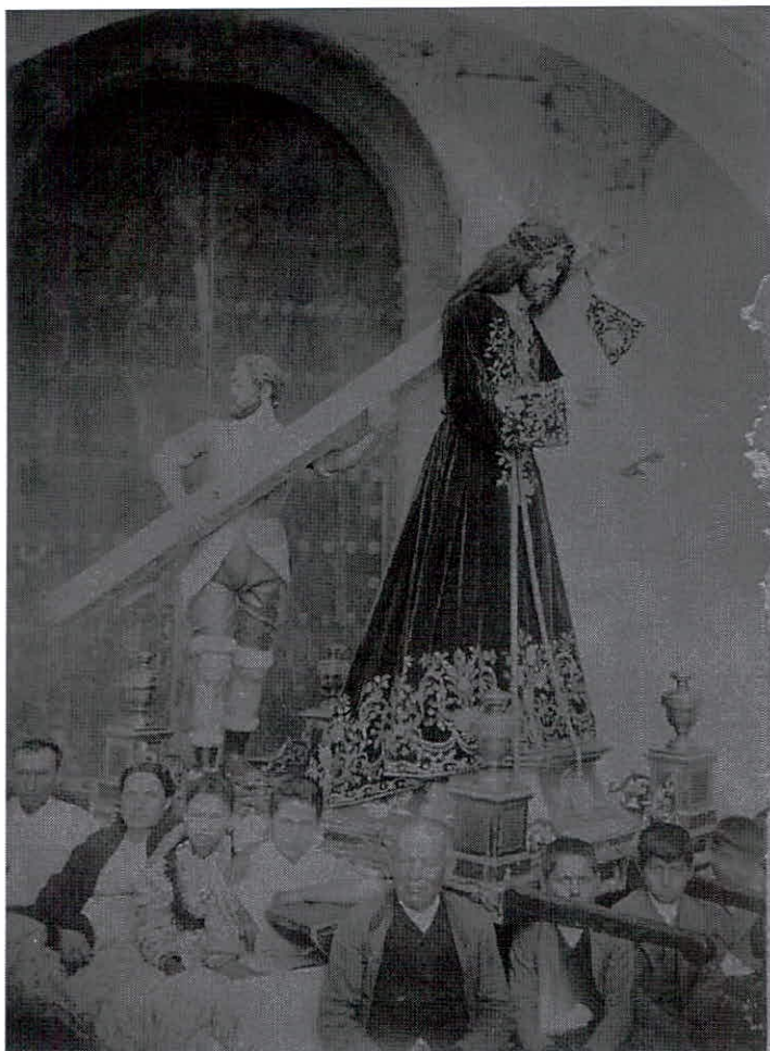
Foto 2. El Nazareno delante de la antigua puerta de la Parroquial. Años 20.

En la planta baja de la capilla, y en sendos nichos en sus muros laterales – que aún permanecen - se ubicaban las de la Magdalena y la Verónica, que completaban la nómina de imágenes que la hermandad procesionaba la madrugada del Viernes Santo. Su entrada estaba flanqueada de “una magnífica cancela de hierro, primorosamente trabajada y de bastante altura”. La misma que el recordado y querido maestro Leva restauró primorosamente para la antigua capilla del Rosario, que hoy preside la bellísima imagen de Nuestra Señora (Foto 1), a la que en estos días rinde la hermandad nazarena los más encendidos honores.