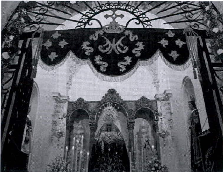
Foto 1. Primero de abril de 2016. La Virgen de los Dolores en su capilla el día del 50 Aniversario.

El escrito que este año damos a la estampa en la Revista de Feria contiene el texto íntegro de nuestra intervención en los Solemnes Actos con motivo del 50 aniversario de la bendición de la Sagrada Imagen de Nuestra Señora de los Dolores, organizados por la Centenaria Hermandad y Cofradía de Ntro. Padre Jesús Nazareno y Ntra. Sra. de los Dolores. Dicha colaboración tuvo lugar en la Parroquia de San Bartolomé de Espejo, el día 25 de septiembre de 2016.