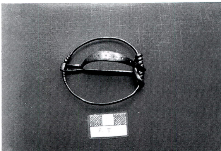
Lám. 4. Fíbula (Museo Histórico Municipal de Fuente-Tójar).

A. Fíbula anular hispánica de aro grande , sólo esá publicada en foto 10 . N o inv. 873-al. Material: cobre, sección de éste, circular. Estado de conservación: excelente. Medidas: grosor del aro, aunque variable, por término medio es de 2 mm.; diámetro mayor, en sentido de la aguja, 72 mm.; diámetro menor, 61 mm.; aguja,