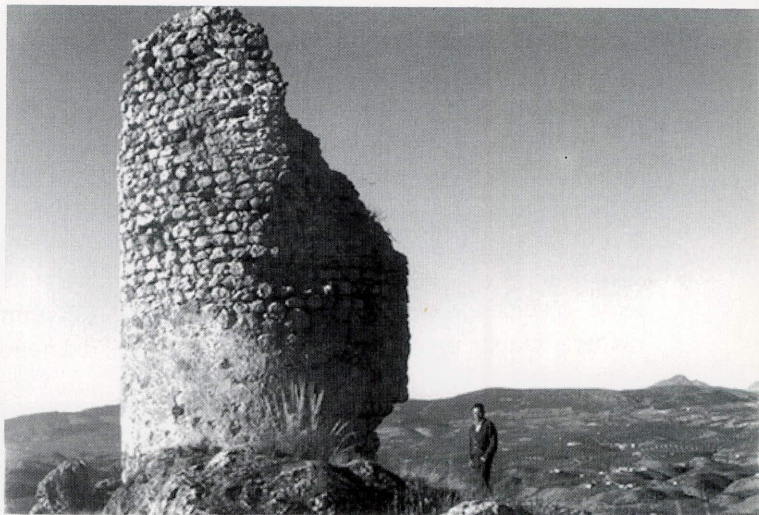
Lám. 3. Torre del Moro (Alcaudete, Jaén).

de Iliturgicola , asentada en el Cerro de Las Cabezas , y la necrópolis de Los Villarones , ambas en el t.m. de Fuente-Tójar 8 , y al N/O., ya en el t.m. de Luque, el Peñón de Juan Mateo , en cuyas cercanías se hallaron diecisiete piezas de arenisca con relieves y grabados de équidos adjudicables a un santuario ibérico 9 .