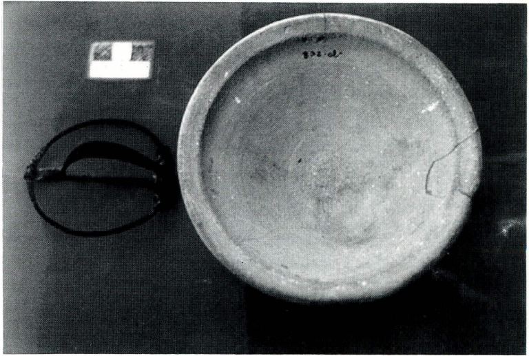
Lám. 2. Fíbula y plato-tapadera (Museo Histórico Municipal de Fuente-Tójar).

por encima de aquéllas y, pasando entre la aguja y el puente, comienza la primera de las cuatro vueltas (que siguen una dirección semejante a las descritas) existentes a la derecha, la última da origen al puente. Puente, muelle y aguja son una misma pieza. El extremo del pie, que es vuelto, aparece liado al anillo y, con el fin de evitar su desplazamiento a través