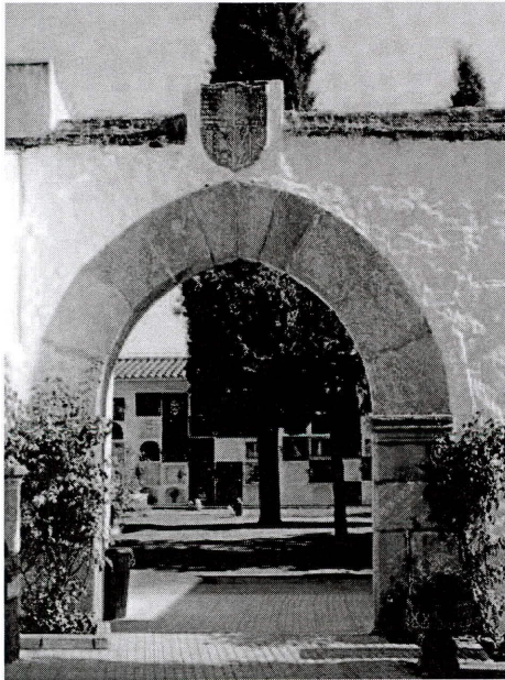
Puerta del antiguo convento franciscano, actual cementerio.

Por fin llegaron los viajeros al convento, al que entraron por la puerta falsa, descargaron las acémilas y les dieron agua y pienso y ellos mismos tomaron un refrigerio. Juanito se marchó a casa de sus padres y Diamantino y Canuto se entregaron al sueño reparador. Cuando despertó a la mañana siguiente, el padre Diamantino no podía articular palabra de la ronquera que tenía y al encender su candileja observó asombrado que sangraba por la boca. Los frailes llamaron de inmediato al médico, que cuando llegó se limitó a decir: “Muerte por asfixia por hemorragia” y ordenó que velaran el cuerpo y no lo amortajaran hasta pasada al menos una hora. Cuando el cadáver se fue enfriando, por las fosas nasales del fraile los religiosos presentes, aterrorizados, vieron salir dos enormes sanguijuelas.