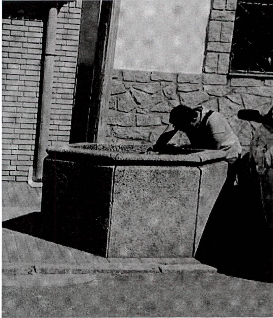
Fuente de la Cava.

Pero, desde entonces, ocurrió una cosa muy extraña: todas las noches, apenas el sol se hundía en el horizonte y las nubes encapotaban el cielo, en esos momentos de calma que preceden a la tempestad, se veía, en pie sobre el torreón del castillo, una figura descarnada y seca, con el cabello suelto al aire, volviendo a todas partes la triste mirada de sus ojos, sin expresión y sin vida; de repente, elevaba la vista hacia el norte; el viento, que rugía, modulaba un grito prolongado, y, al espirar, otra sombra, la sombra de un hombre armado de todas armas, pero con la cabeza desnuda, surgía también sobre el arruinado alcázar. Y los dos fantasmas se miraban, clavaban uno en otro sus pupilas sin luz y entonces era cuando el huracán rugía con más fuerza. En aquellas horas, largas como el dolor, nadie se atrevía a salir a la calle, por miedo a encontrarse en las sombras de la noche con aquella mirada brillante que parecía desencadenar los elementos para lanzarlos sobre el mundo.