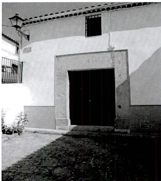
Casa del Judío.

Al día siguiente, Aristeo empezó a sufrir unas fiebres altísimas, mientras por su boca salían palabras inconexas, como: “el rosal está seco”, “forman el esqueleto”, “su carne es pura”, “me pide el bautismo”, “sus ropas se convierten en pavesas”, “se desintegra”... Y así estuvo el joven hasta que murió pocos días después, recitando hasta su último instante aquellas locuras, ¿o eran verdades?