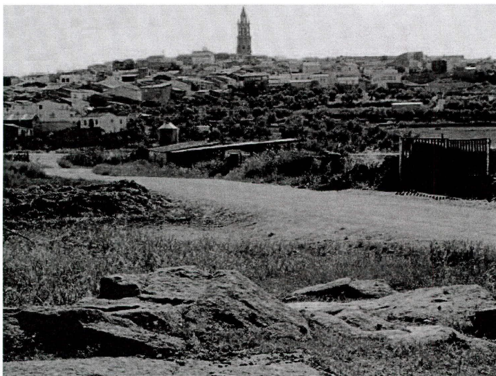
Peñita del Serrano.

Asomaban las primeras luces del alba y el ambiente olía a zarzaparrilla, romero y poleo. Y en ese entorno se produjo el desencantamiento y Felipe allí se quedó encantado, suspirando por Aixa, que en esos momentos estaba radiante, mientras p0onía rumbo a la ciudad de la Alhambra.