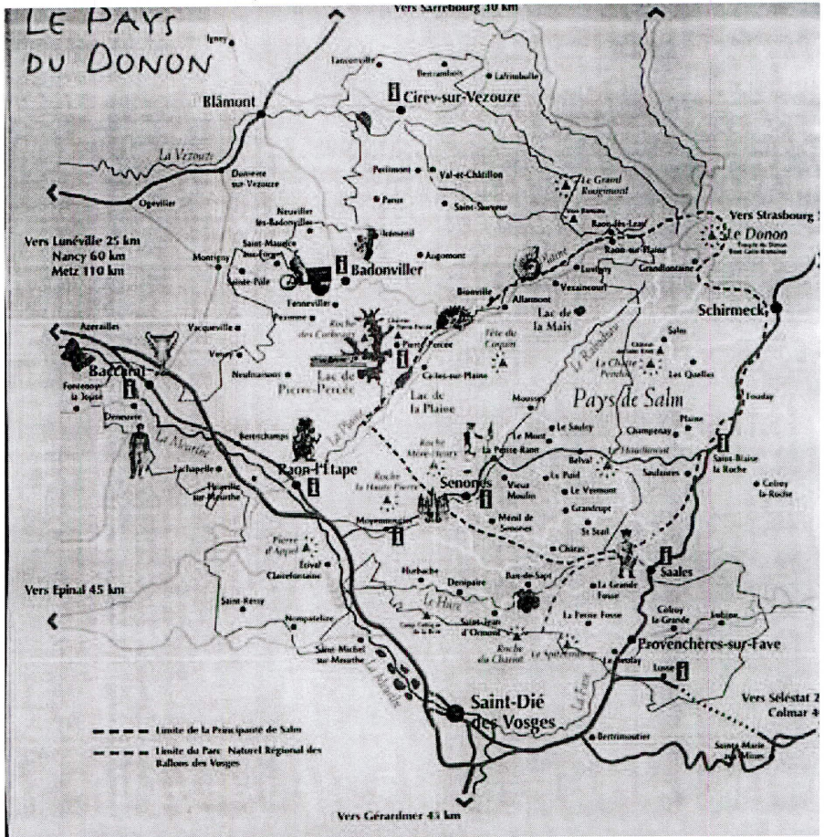
Mapa del Principado de Salm.