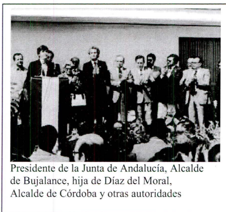
Presidente de la Junta de Andalucía, Alcalde de Bujalance, hija de Díaz del Moral, Alcalde de Córdoba y otras autoridades