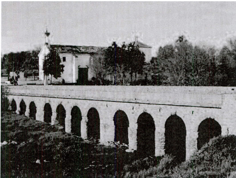
2. Vista general del puente.