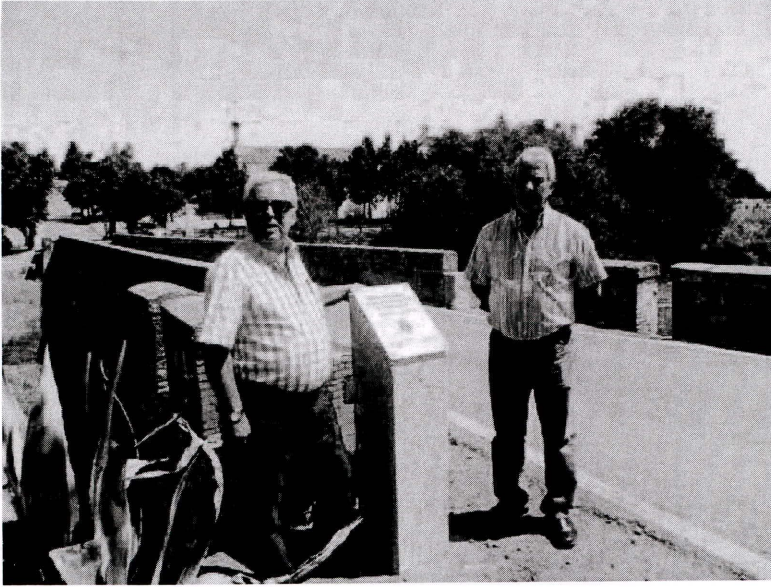
3. El cronista y el alcalde descubren una placa conmemorativa del centenario.