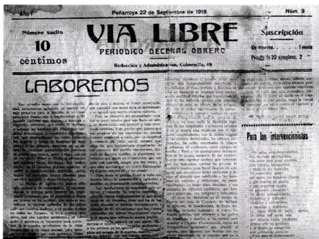
Portada de “Vía Libre”.