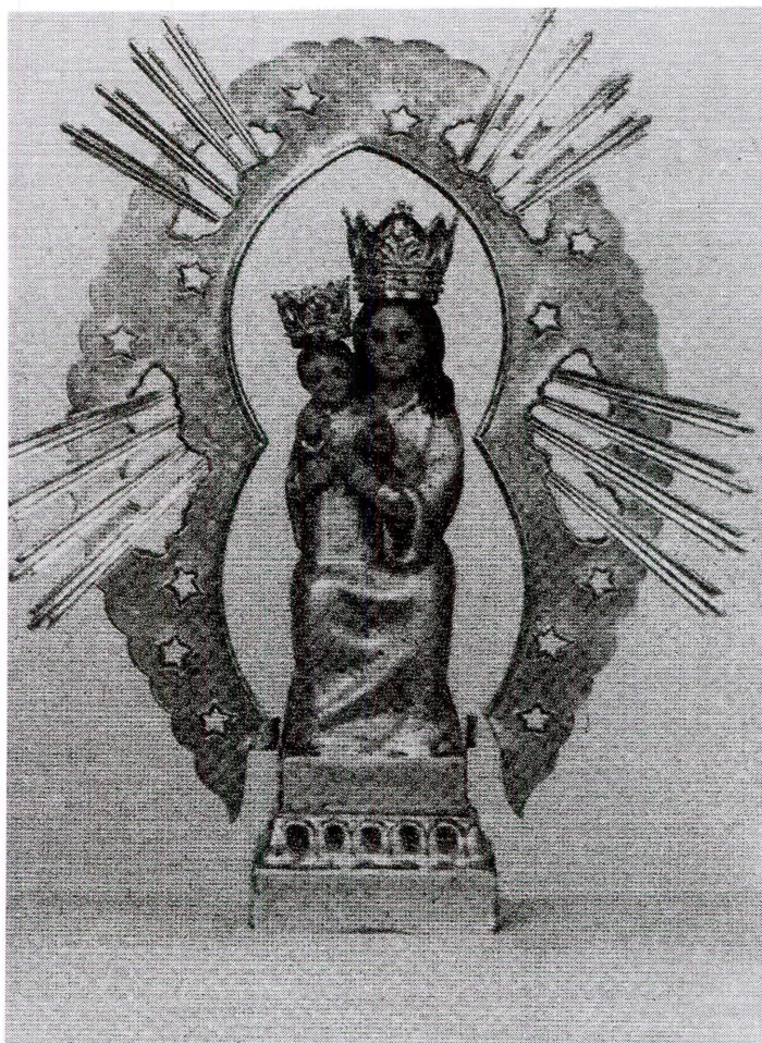
Ntra. Sra. de Guia Patrona de Villanueva del Duque