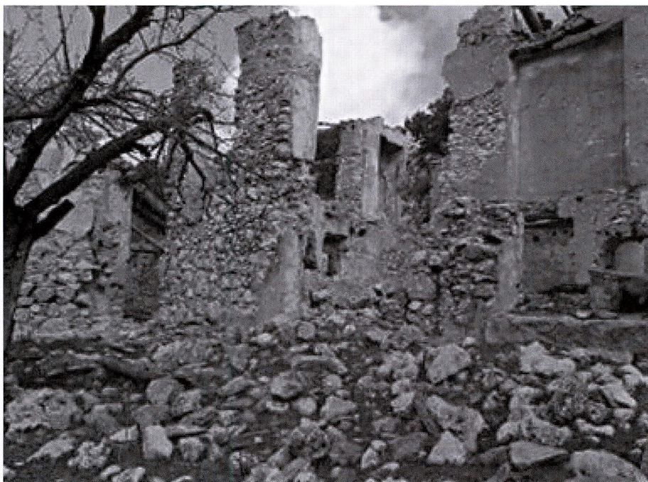
Ruinas del Cortijo "Prados de Luque"

Como nos refleja la correspondencia que hemos estudiado la recolección de la nieve se realizaba a base de palas, azadones, espuelas y capachos, que se utilizaban para el transporte desde el ventisquero, que ya hemos definido y localizado en el cerro Lobatejo, hasta los pozos. Una vez llenos de nieve, aplastada en capas, y separada por paja y forrajes, se tapan hasta abrirlas a finales de la primavera. Queremos pensar, que una vez llenos los pozos, si quedaba nieve suficiente, ésta se acumularía en la hondonada del ventisquero. La estructura de bardillas rectangular, podría acumular también una gran cantidad de nieve que podría ser tapada. Una vez llena el resto de la nieve, si aún hubiese, se acumularía contra las bardillas e incluso podría tapar toda la hondonada del ventisquero. Evidentemente esta nieve sería la primera en venderse. Al