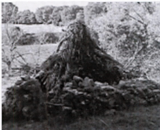
“Restos de Chozas Tronco-cónicas zuhereñas en Fuenfría.”