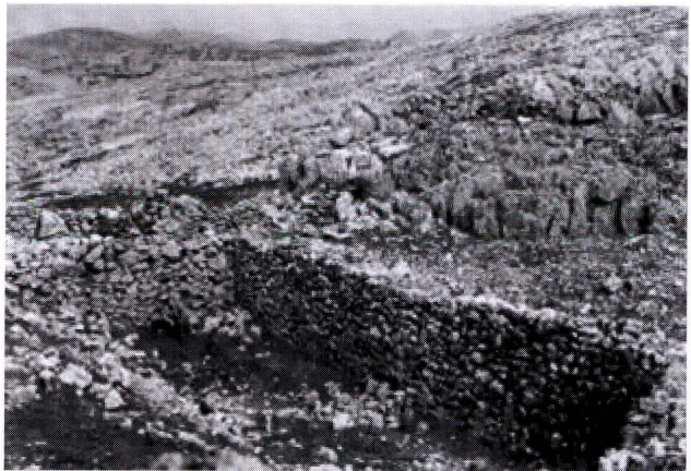
Ventisquero en el Cerro Lobatejo de Zuheros

calones que nos conducen hacia la cima. Sin llegar a esta, existe una ancha meseta donde apreciamos sobre el terreno, unas pequeñas bardillas en semicírculo, casi a nivel de suelo, que nos llaman la atención. Algo más adelante un profundo hundimiento se ve limitado por cuatro bardillas de gruesas piedras formando un rectángulo. Las bardillas superan los dos metros. Cualquier lugareño puede atribuir-