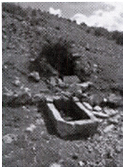
Pozo y Pila abrevadero de los “Prados de Luque”