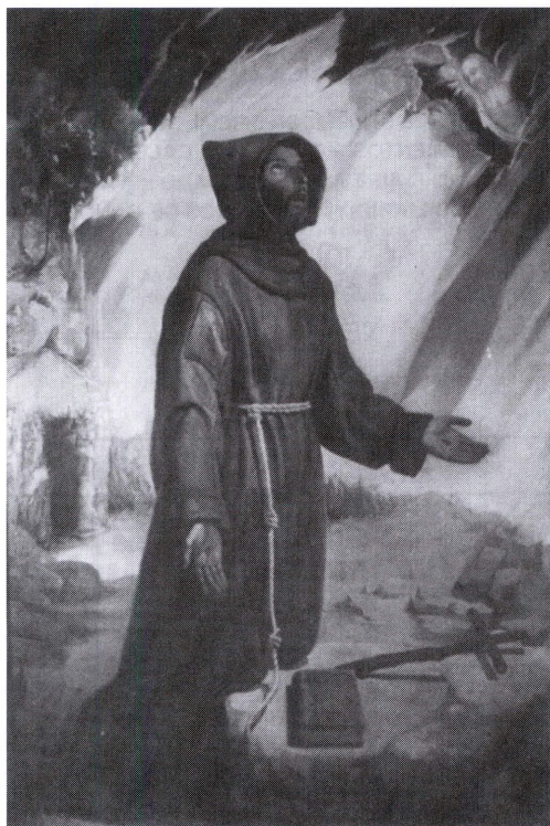
San Francisco de Asís, de José Herruzo

José Herruzo Álamo muere en Pozoblanco el día 4 de junio de 1984 y allí está enterrado. El ayuntamiento de esa localidad le declara Hijo Adoptivo de la ciudad el 22 de enero de 1993 y en abril de ese mismo año el pleno le concede su nombre a una calle.