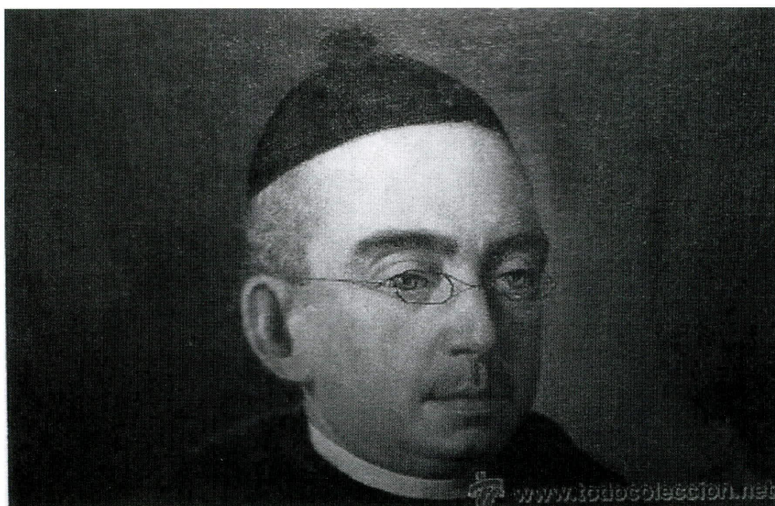
Retrato de clérigo