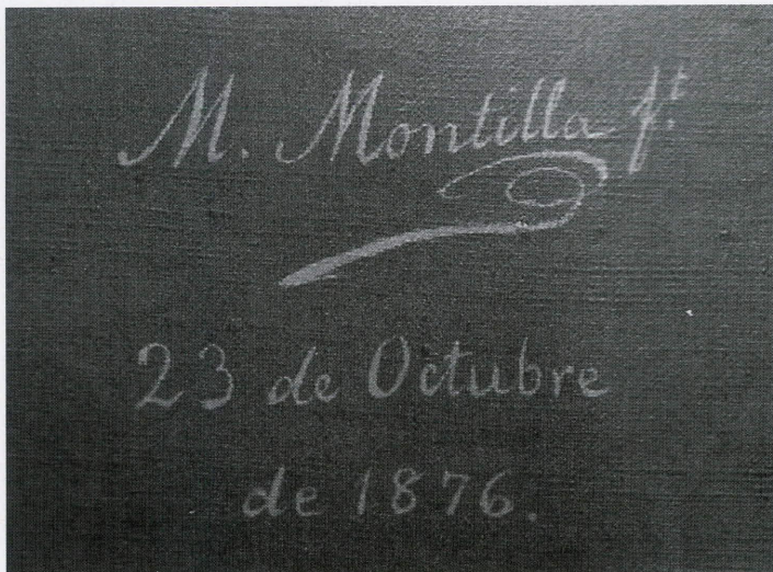
Firma del pintor