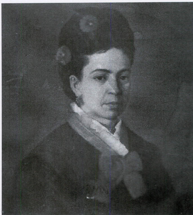
Retrato de dama