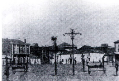
Plaza de Santa Bárbara en los primeros años 20

era obligatorio desde 1905- y remarcarían que ellos, los conservadores, tuvieron que enfrentarse en solitario a liberales y republicano-socialistas que habían hecho una campaña de todos contra los conservadores 16 .