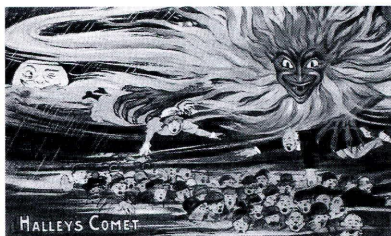
El cometa Halley, según una ilustración de la época

Finalmente según el autor de la serie de artículos, el astrónomo D. José Comas Solá, termina confirmando a cuantos le escriben: «sin reticencias y con total sinceridad que no hay absolutamente ningún peligro en el paso de la Tierra dentro de la cola del cometa Halley. Otras veces han ocurrido casos análogos y no ha pasado nada» para que se sosieguen cuantos hayan sufrido preocupación por esta causa o por haber prestado su atención a determinados escritos sensacionales».