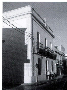
Casa del primer Alcalde de Pueblonuevo del Terrible