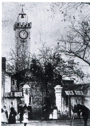
Dirección de la SMMP en Pueblonuevo del Terrible. (Libro del Centenario)

De este Cerco, el erudito belmezano Hilario J. Solano, comentaría meses después sus impresiones sobre la visita realizada a las «sorprendentes» instalaciones de la que él llamaba Sociedad Hullera y Metalúrgica de Peñarroya guiado por un Ingeniero, escribiendo que « La grandeza de aquellas obras causaría admiración, no sólo al profano que como yo sólo puede admirar en su conjunto, por sus efectos, sino al ingeniero ilustrado que no las conozca y aprender quiera y al sólo objeto las revise detenidamente». Y es que es testigo del montaje de ocho modernas calderas que solo precisaban de 2 obreros para su mantenimiento, ya que funcionaban mediante procesos automáticos de autoalimentación y autolimpieza. Se asombra al conocer el funcionamiento de los nuevos hornos de coque que se cargaban mecánicamente y del aprovechamiento de los humos producidos durante el proceso de calcinación mediante la destilación que permitía la obtención de valiosos subproductos como el alquitrán, la bencina, el benzol, la brea, la creosota y la naftalina, entre otros.