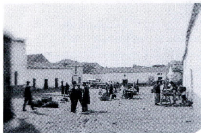
Plaza Mayor de Peñarroya en la que estaba el Ayuntamiento. (V. Vera)

“Voy a contar un cuento, una sorpresa cierta vista en el ayuntamiento, en el umbral de la puerta. un bulto apareció que causó sobresalto, y luego se averiguó que era un bacín con un plato. Los vecinos lo corrían sin atreverse a llegar y después todos repetían: Que la cosa, que la cosa huele mal.”