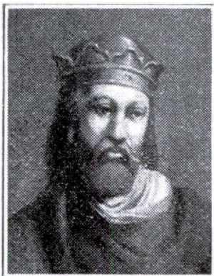
ALFONSO VI (1072 a 1109)