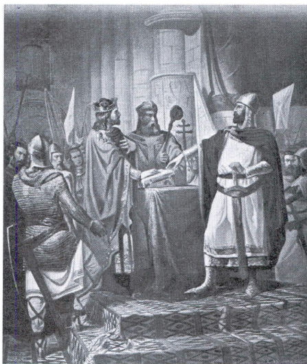
LA JURA DE SANTA GABEA (AÑO 1072)

Igualmente estaban presentes los Condes de Lara, los infantes de Carrión, Pedro Ansúrez con sus hermanos Gonzalo y Fernando, el conde Enrique de Borgoña yerno del rey casado con su hija Teresa, Condes de Lusitania.