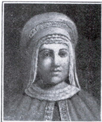
DOÑA URRACA (1109 a 1126)