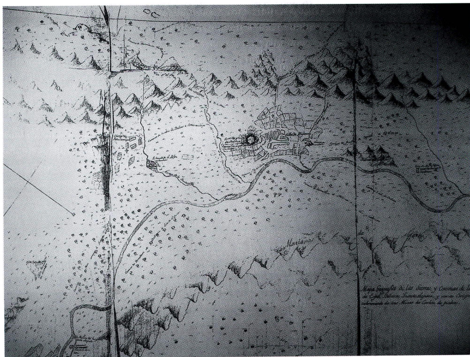
Mapa de Belmez y de las minas y aldeas de Peñarroya a finales del s.XVIII