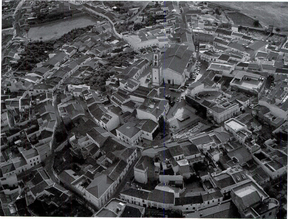
Parroquia de Fuente Obejuna en 2006

negaba toda clase de auxilio al destacamento y en el año 1810 llegó a detener en la cárcel del pueblo a un tal Vicente García, vecino de Madrid y criado que era de D. Frutos Álvaro, por usar monedas con la efigie de José I. En aquellos azarosos tiempos realizar un acto así se equivalía a la condena a muerte del alcalde si llegaba al conocimiento de la guarnición francesa que custodiaba el castillo» 6 .