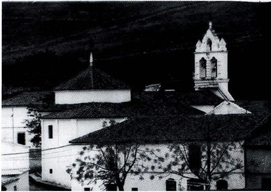
Real Iglesia Matriz de Nª Sª del Rosario de Peñarroya. 1993

Esta Constitución no sería respetada por el rey Fernando VII, el Deseado, que a su regreso del destierro en Valençay