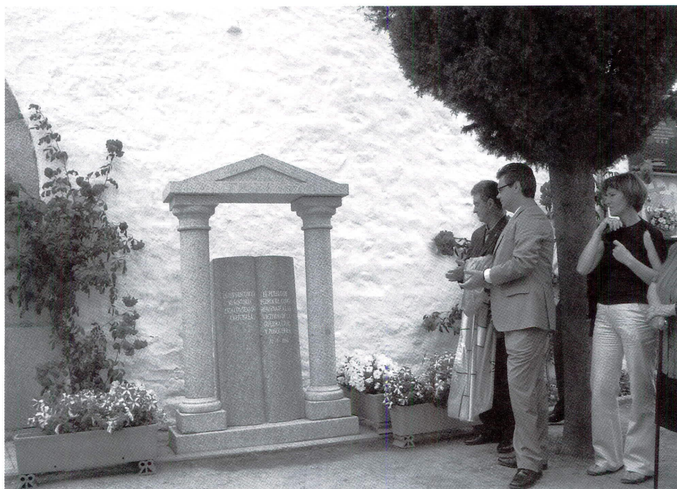
Monumento a las víctimas de la Guerra Civil en Pedroche