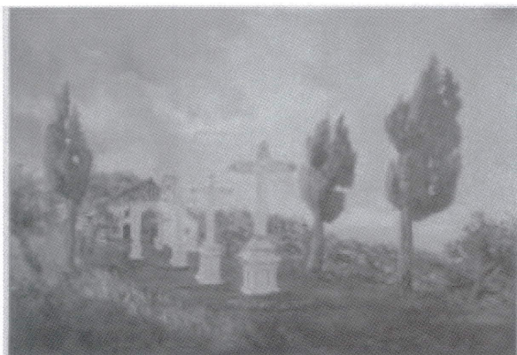
Vista del Calvario a principios del siglo XX, óleo de Francisco Ruiz Santaella.