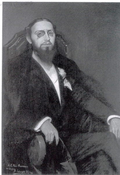
Francisco Ruiz Santaella óleo de Adolfo Lozano Sidro.