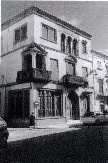
Calle de Julio Motilla en la calle Río