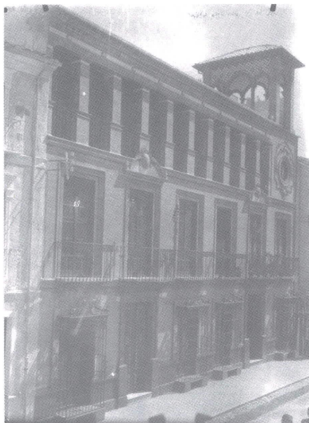
Casa de Manuel Aguilera, diseño de Francisco Ruiz Santaella