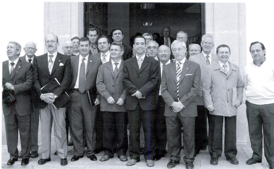
Algunos de los cronistas asistentes a la reunión de Cañete

Finalizado el acto de recepción, todos los asistentes se desplazaron hasta el salón de actos de la Caja Rural “Ntra. Sra. del Campo”, donde tendría lugar el