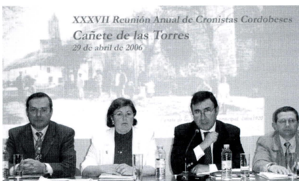
Mesa presidencial en la XXXVII Reunión anual celebrada en Cañete de las Torres