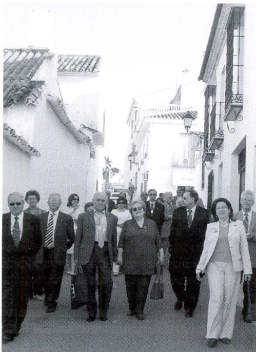
Cronistas y acompañantes paseando por Cañete

Alternativamente a las sesiones de trabajo, muchos de los acompañantes habían girado visita a la Ermita de Jesús, antigua Ermita de la Vera Cruz y a las Cruces de Mayo. Más tarde,