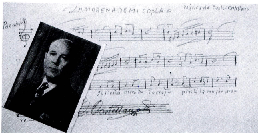
El maestro compositor Carlos Castellano

Este fecundo autor e ilustre montalbeño, consiguió que su música alcanzara las más altas cotas de audición en el mundo entero.