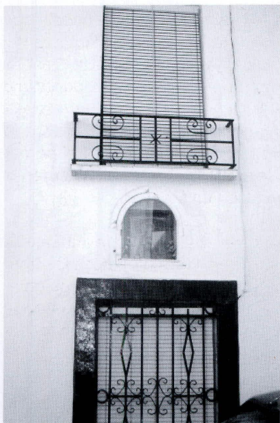
Hornacina con la imagen de Ntra. Sra. de los Dolores en la confluencia de las Calles Cerrillo y Llana

de la virgen. En el informe también se da cuenta que el carpintero Juan José Malbo iba a realizar un marco a dicho lienzo, pues hasta el momento carecía de este respaldo 47 . El historiador Criado Hoyo nos dice que a mediados del siglo XIX se dio nombre a esta calle por el cuadro que hemos tratado 48 . Según referencias de la oficina técnica del plan especial del casco histórico de Montoro, en el 2000 se llevaron a cabo gestiones para restaurar el cuadro como consecuencia de las obras que se hicieron en la casa que alberga la hornacina.