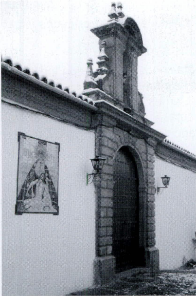
Azulejo dedicado a Ntra. Sra. de las Angustias en la ermita de San Sebastián

Por otro lado el sentir religioso de los símbolos también se deja entrever en ciertos frontones y dinteles de las casas de Montoro, aunque no nos detendremos en este aspecto, pues nada más que este estudio nos llevaría más de un artículo.