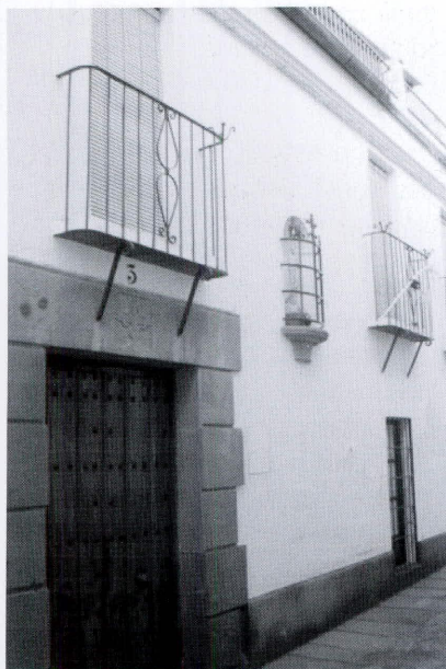
La llamada Casa del Cura con el enrejado donde se venera la imagen de una Virgen en la calle del Postigo

el paseo de la Virgen de Gracia. También se le llamó camino de la Glorieta y Cruz de la Rehoya 29 . En el siglo XIX se redactó el proyecto de la llamada Glorieta, en el que se dispuso colocar en el centro un pequeño triunfo de advocación religiosa. En 1818 Juan Camacho Granados se dirigió al Concejo montoreño para pedir cierto terreno de tierra calma, que se localizaba en la Chorrera del pilar de las Herrerías lindando con el veredón que se dirigía a la Cruz del Realejo 30 .