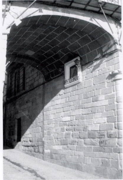
Arco de la cárcel donde a lo largo del tiempo han ido quitando y colocando imágenes. Actualmente se conserva una dedicada a Ntro. Padre Jesús Nazareno y otra a la Inmaculada Concepción