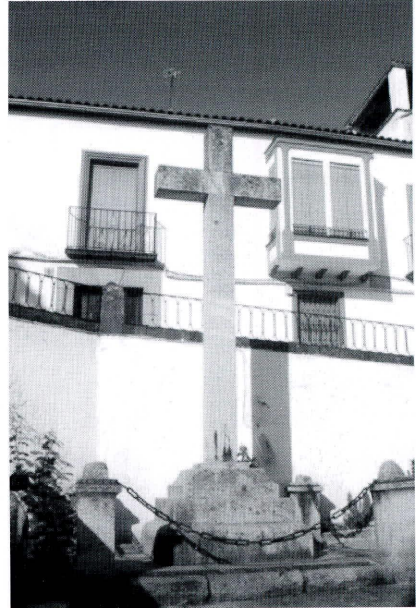
Cruz de los Caídos en la plaza de Jesús Nazareno