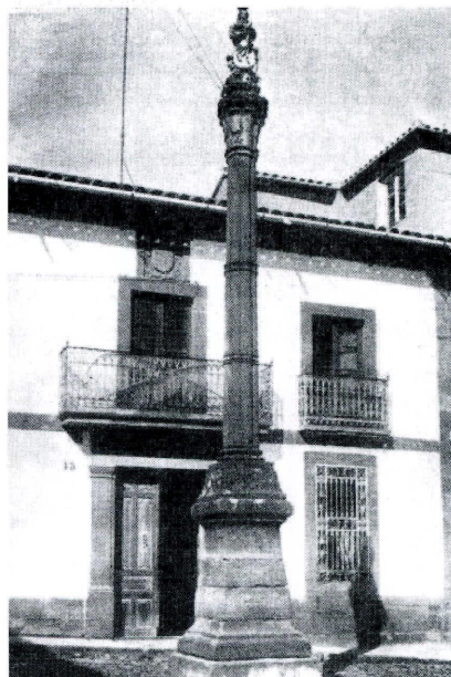
Obelisco de la Virgen erigido por D. Fernando José López de Cárdenas en el siglo XVIII (según Criado Hoyo)

Comenzaremos por aquellas que se han ido perdiendo con el paso de los años. Un ejemplo lo tenemos en la calle de Los Laras en conexión con la calle Ventura y Ceniza. A esta zona se le conocía desde el siglo XVII hasta principios del siglo XX como calle del Ecce Homo, ya que en sus inmediaciones existía un busto que representaba esta imagen pasional. Gracias al historiador Criado Hoyo sabemos que esta imagen se retiró de la casa frontera a la calle Ventura tras la reforma que se efectuó en esta vivienda a principios del siglo XX 21 . Los primeros datos que tenemos sobre esta talla datan de 1715, año en el cual se llevó a cabo el aprecio de una casa instalada en este barrio a la muerte de su propietario. Gracias a las referencias que en este contrato se reflejan se puede intuir que este Cristo fue depositado en la hornacina por un tal Heredia: