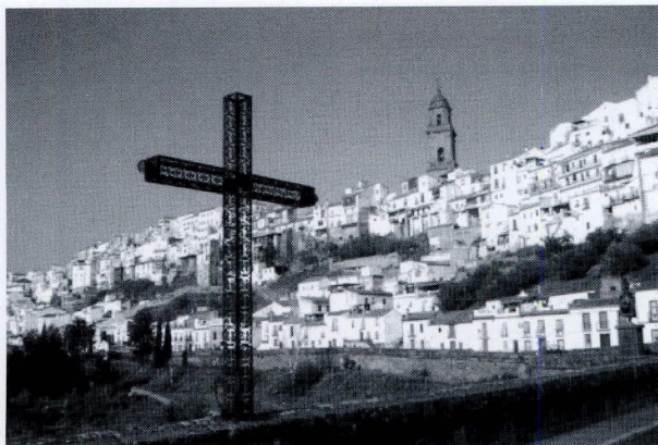
Cruz del puente de las Donadas

Señor caminando al Monte Calvario. También ha sufrido daños durante la guerra estimándose necesaria su reparación a los fines de restaurar tan tradicional como piadosa devoción...”.