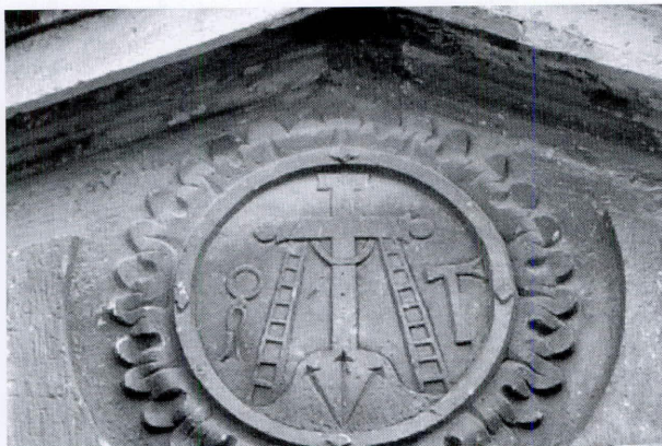
Frontón de la iglesia de Santiago

alejadas del núcleo urbano. Estos fueron Nuestra Señora de Gracia, San Roque y San Sebastián, cuyas dos últimas advocaciones estaban muy relacionadas con los protectores de la peste bubónica, que azotaba en graves epidemias la gran parte de la población de la época. Después de estos se sucedieron las fundaciones entre fines