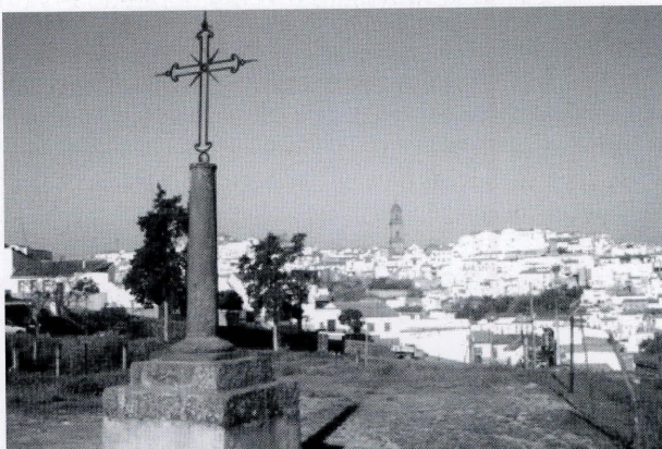
Cruz del vía crucis del Calvario, realizada durante el Domingo de Ramos por la desaparecida hermandad de Jesús del Calvario sita en la recién demolida ermita de San Roque

En Montoro se conservan visibles dos de estas fuentes: El Cañito y las Tenerías, aunque no descarto la posibilidad de que existan algunas más, ya que la tradición oral de nuestros mayores hablan de “cuevas” largas cerca de muchas albercas y pozos del término, que taparon por ser refugio de ratas y otros animales. El perfil de ambas fuentes es el mismo, abombado. Están excavadas en la roca madre, no pudiéndose decir con exactitud cuál es la longitud de las mismas. El Cañito parece tener una longitud aproximada de unos diez metros, presentando en su parte final un ligero quiebro, por lo que es fácil que en el interior exista un receptáculo para la toma de las aguas. La altura es de un metro y medio, y la anchura algo más de medio metro. En la parte occidental del inicio del Qanat, existe un pequeño orificio que posiblemente