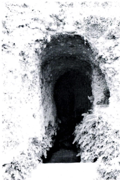
Qanat del cañito con la hornacina en el lateral derecho

Otro de los humilladeros que existían en Montoro se encontraba en el paraje de la Virgen de Gracia. Este permaneció allí hasta que en 1867 se construyó