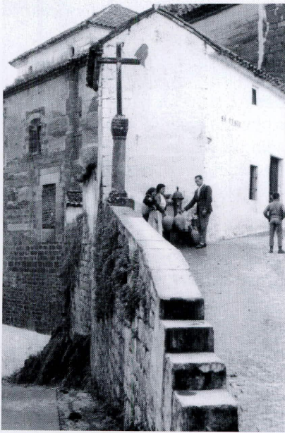
Cruz de la calle Santiago en 1959. Detalle de la cruz de madera

serviese para acoger a una pequeña imagen, que los ciudadanos tendrían como protectora de ese lugar, o como un punto donde permanecerían una serie de candiles u otros utensilios factibles para la iluminación de las personas, que accedían hacia el interior de la canalización. Existen muchas más fuentes de este tipo repartidas en el interior de la villa como por ejemplo las inmediatas al pilar de las Herrerías, la que atraviesa la calle Corredera, o la que vierte sus aguas al Camino Nuevo.