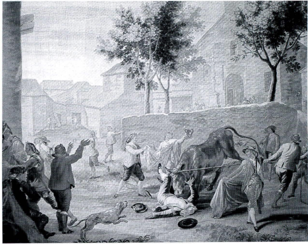
El toro del aguardiente y los vecinos de Carabanchel, por Bayeu

Nos cuenta el escritor prieguense en el año 1871: "Durante el mes de junio se celebraron varias corridas o capeas de vacas en la Carrera del Águila. A este efecto, se cortaba la calle con una empalizada de madera por bajo de los dos Altillos y se establecía otra tercera valla para separar el Paseo. El toril se situaba a la entrada de la calle de Santa Ana, y de allí salían las reses. Por