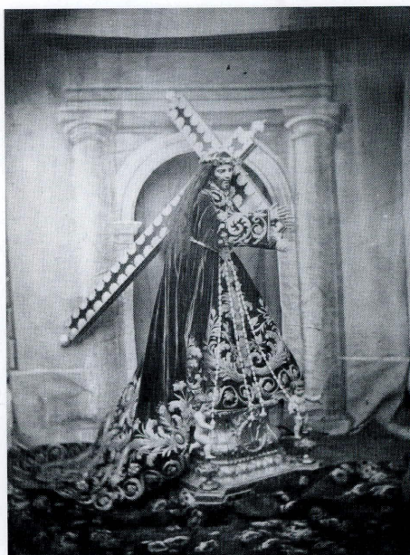
Jesús Nazareno. Enmarcado en el año 1887