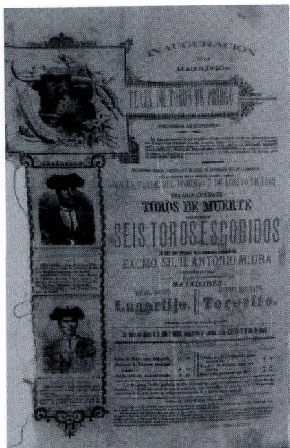
Cartel de la corrida de la inauguración. Archivo: Machado

calde, honra la vara, y como literato, las españolas letras.