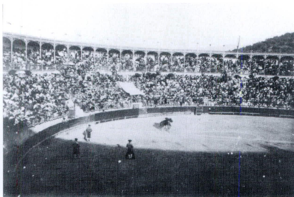
Corrida de la inauguración

procurar una mejora tan importante a la hermosa e insólita ciudad de la incomparable Fuente del Rey y del sorprendente paseo de Los Adarves.