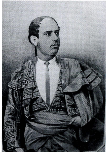
Guerrita. Litografía de La Lidia

Los hermanos del Nazareno echaron este año la casa por la ventana y si los columnarios en junio alcanzaron su máximo esplendor conocido hasta entonces, en agosto tuvieron una bien cumplida réplica. Se programaron cinco días de fiestas y extrañamente comenzaban en domingo, día tres, y terminaban en jueves, día 7. Para iniciarlas la imagen titular fue trasladada a la iglesia parroquial el primer día. En los días siguientes hubo veladas en la Fuente del Rey, engalanada e iluminada, con asistencia de la música marcial y vistosos fuegos, además de un magnífico castillo de fuegos artificiales en el Paseo. Continuaron los festejos con diana por la banda de música de Bomberos de Málaga, misa de campaña en la Fuente de la Salud y velada magna con iluminaciones extraordinarias desde la Fuente de Rey, Río, Plaza, Rivera, hasta el Llano de la Iglesia: “Y llegó con esto el jueves 7 de agosto, el día de la solemne fiesta... ¿por qué no decirlo? el día más hermoso que Priego ha conocido. Los forasteros habían venido a millares y para que no se me crea exagerado, citaré estos dos detalles: primero, que no cabiendo los carruajes llegados de fuera en las casas particulares, ni en las hospederías, hubo de habilitarse el Paseo y convertirlo en inmensa cochera; segundo, que a pesar