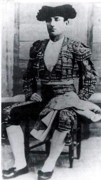
Rafael Molina Sánchez, Lagartijo

Anoche era tan incesante el llegar de gente que a pie, a caballo y en carruaje penetraban en la ciudad, que figurábasenos estar en Lourdes o en Covadonga en vísperas de la festividad mayor de uno de aquellos célebres santuarios.