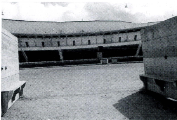
Coso de las Canteras.