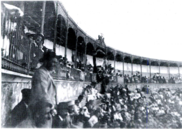
Festejo en la plaza prieguense

Este organizó dos corridas de novillos para los días de San Juan y de San Pedro. Dióse solamente la primera, en la que actuó con lucimiento el célebre Bebé; la segunda no se pudo celebrar porque una gran tormenta que descargó el día de San Pedro lo impidió.