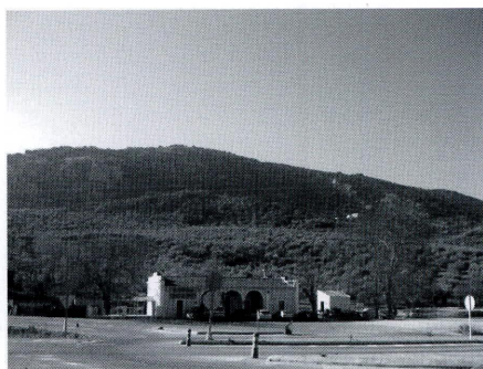
La Sierra “entre Cabra y Zuheros” donde se repartieron heredades en 1264.