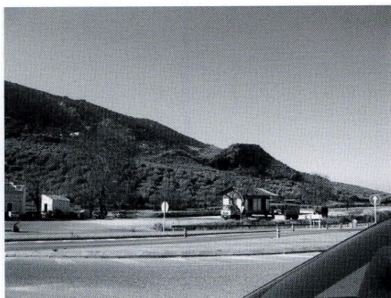
Vista de El Laderón de Doña Mencía.

Vease la situación de Villanueva, hoy Alta y Baja, al suroeste de Doña Mencía termino municipal, hoy de Cabra, pagos atravesados por la vía de ferrocarril Puente-Genil Linares, hoy vía verde. Es probable que en el siglo XIII, que esta zona repoblada fuera el termino de la población que hubo en El Laderón y que luego a grandes rasgos se repartieron entre Cabra y Baena.