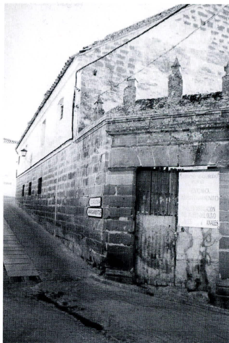
La Tercia de Montoro

En su relación con las cofradías citaremos varias actuaciones. En 1773, varios cofrades de las hermandades del Nazareno y del Santo Entierro habían planteado un recurso para que prosiguiesen porteando las mismas personas las de Nuestro Padre Jesús Nazareno y las del Descendimiento de la Cruz. El ocho de abril, unos días antes de la celebración de la Semana Santa Peral resuelve el caso 30 .