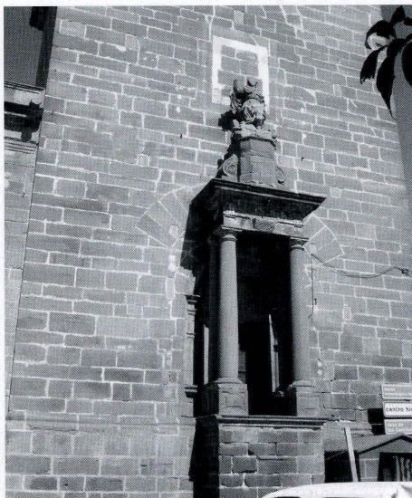
Monumento a San Rafael, ubicado en la iglesia parroquial de San Bartolomé