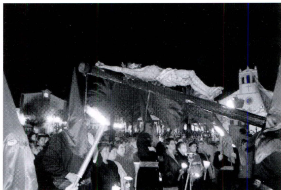
Cristo Crucificado y del Amor en la "Procesión del Silencio" en la madrugada del Jueves Santo