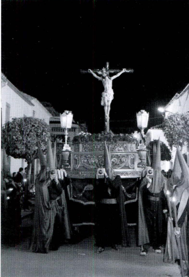
Cristo Crucificado y del Amor en la "Procesión General del Viernes Santo"