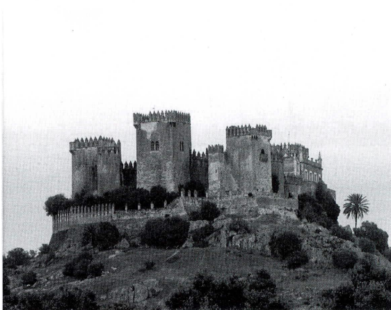
Vista del castillo de Almodóvar del Río

Y es que la investigación requiere no solamente repasar los abundantes archivos de las grandes bibliotecas, sino también los escondidos en los diversos pueblos que por falta de tiempo o por no haber investigado en ellos no se encontraron anteriormente.... Este es el caso de la venta de la villa y castillo de Almodóvar del Río.