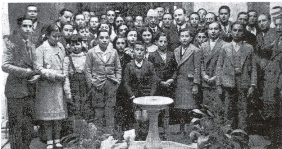
Memoria del Instituto Elemental Alcalá-Zamora. Cursos 1933-34 y 1934-35