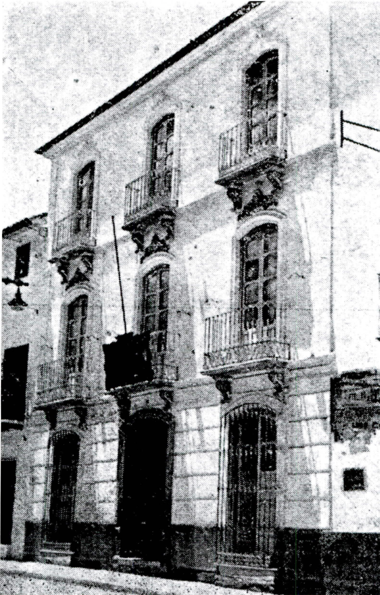
Memoria del Instituto Elemental Alcalá-Zamora Cursos 1933-34 y 1934-35

Instalado el Instituto Alcalá-Zamora en este edificio provisional, se han realizado por cuenta del Ayuntamiento importantes obras para el mejor acoplamiento de clases, laboratorios y dependencias.