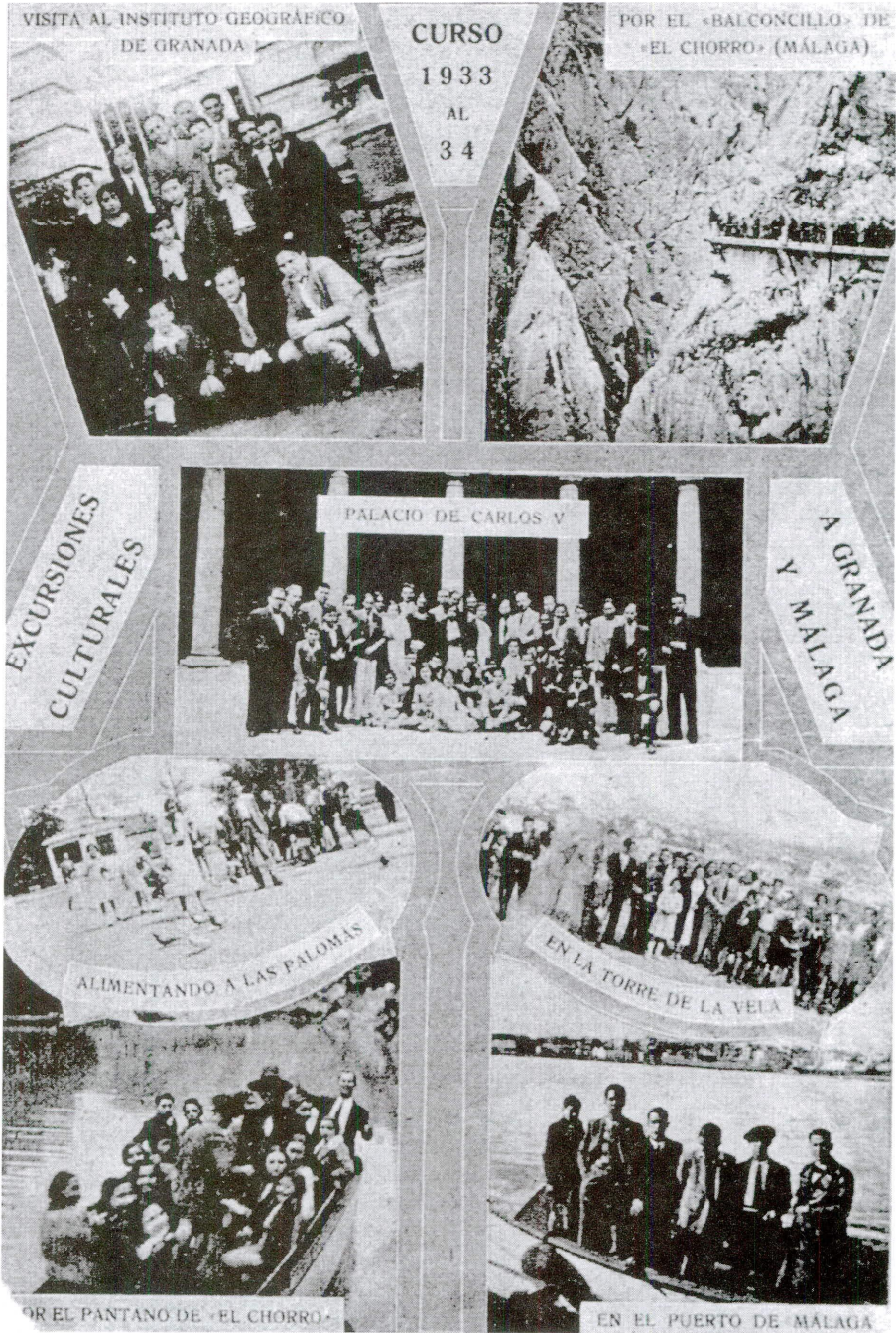
Excursiones culturales. Visitas a Granada y Málaga: Curso 1933-34