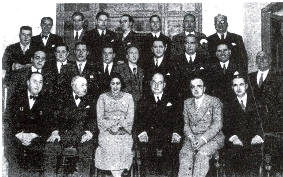
Memoria del Instituto Elemental Alcalá-Zamora. Cursos 1933-34 y 1934-35