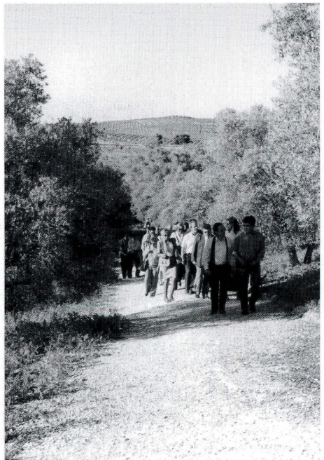
Jornadistas por el Itinerario botánico de la reserva natural de la Laguna de Zóñar