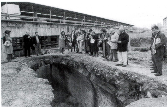
Miembros de la Asociación y otros acompañantes contemplan las ruinas del criptopórtico del palacio de Maximiano Hercúleo en Cercadilla (Córdoba).