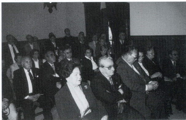
Aspecto del Salón de Plenos del Ayuntamiento durante el acto de recepción oficial.

El segundo fue el de solicitar para Aguilar la celebración de uno de esos encuentros anuales. Había podido comprobar como en tantos años de reuniones nuestro pueblo no había acogido un acto que yo entiendo fundamental por su triple dimensión: la convivencia de todos los cronistas, un colectivo que algún día será valorado en su dimensión justa; las aportaciones científicas, cada vez de mayor enjundia, y el conocimiento del pueblo que actúa como anfitrión. Hoy me siento orgulloso de ver como esos dos objetivos se han cumplido. Y me siento orgulloso, también, de compartir con tantos amigos, a los que estimo sinceramente, la hospitalidad y la belleza de nuestro querido pueblo. Esperamos que, al final del día, todos ustedes se sientan más atraídos por el encanto de la vieja Poley o Bulay , que la incluyan dentro de sus itinerarios y que, el día de hoy, sea el inicio de una relación de fructífero entendimiento entre todos ustedes y un pueblo, el nuestro, ornado por un extraordinario patrimonio histórico y artístico que tenemos la obligación de legar al futuro.