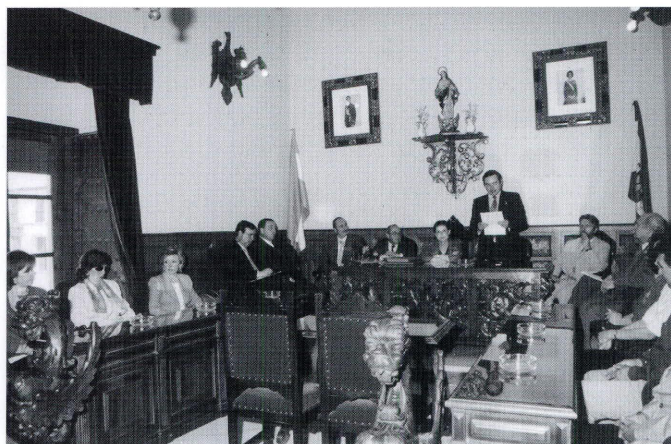
El Presidente de la Asociación agradece a la Sra. Alcaldesa y Ayuntamiento de Aguilar la grata acogida dispensada a los Cronistas Cordobeses.

Todos los años, por estas fechas, la Asociación Provincial Cordobesa de Cronistas Oficiales celebra su Reunión Anual en un municipio de la provincia por acuerdo de la Asamblea General de la Asociación, previa solicitud del Ayuntamiento correspondiente y de su Cronista oficial. En esta ocasión la XXXIII Reunión de Cronistas Cordobeses se celebra en Aguilar y creo que, tanto el Ayuntamiento aguilareño como la propia