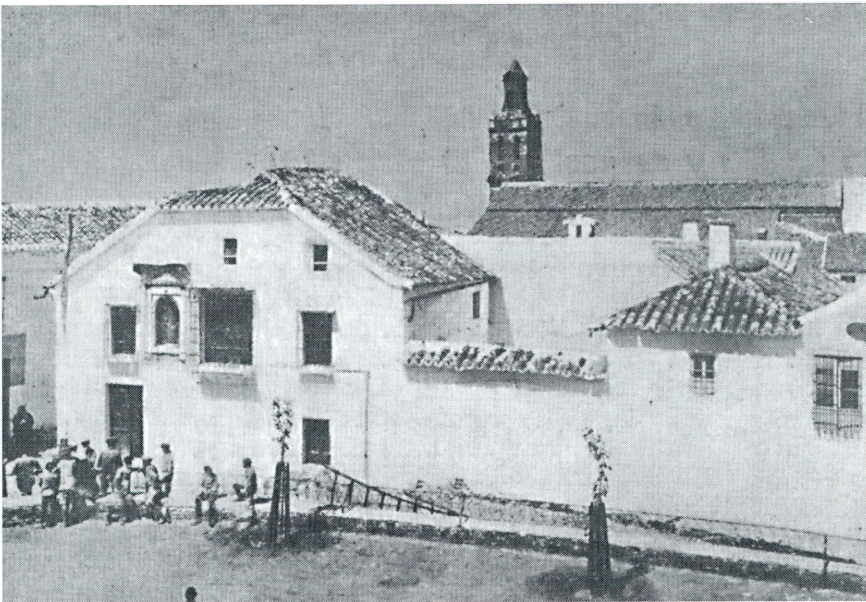
Vista de la casa donde nació D. Alejandro Lerroux

Y entonces el paisaje se disloca. Echa uno cuesta abajo, entre caminos quebrados, se sumerge poco a poco en la trinchera de una rambla; ahí está mi pueblo.