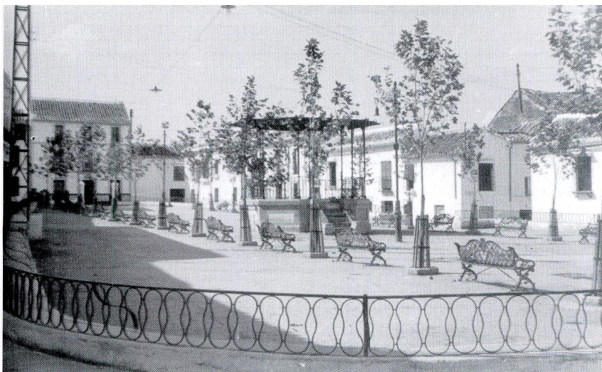
El que llamó Paseo de Alejandro Lerroux el año 1935