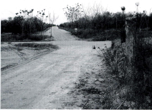
Tramo de la vereda de Zóñar denominado "vereda de los Pinos"

las veredas una anchura de 40 varas castellanas (equivalente a 33,4 m.), distancia entre un olivar y otro, ambos viejos, en el sitio de los Frailes de la vereda de Zóñar, abierta desde tiempo inmemorial.