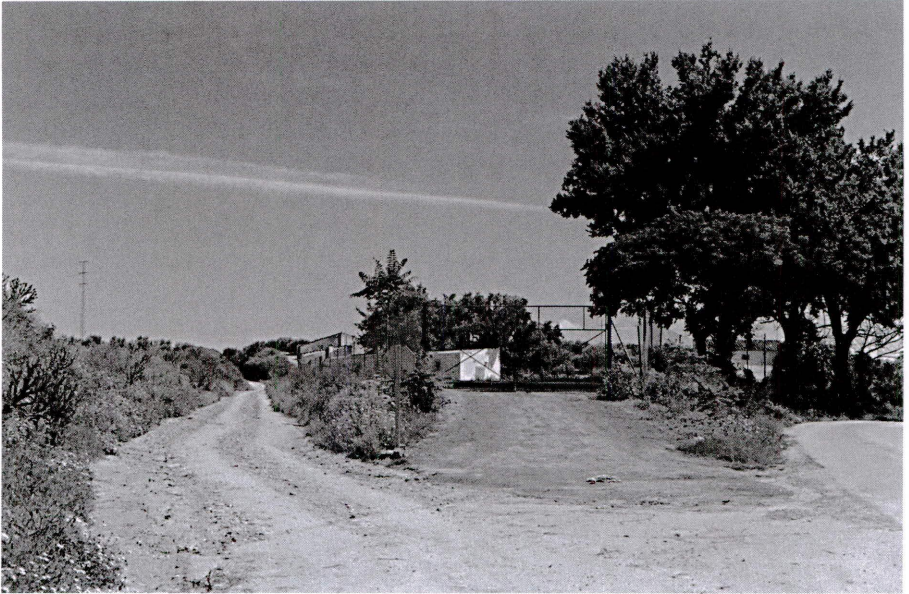
La Vereda Jaén.