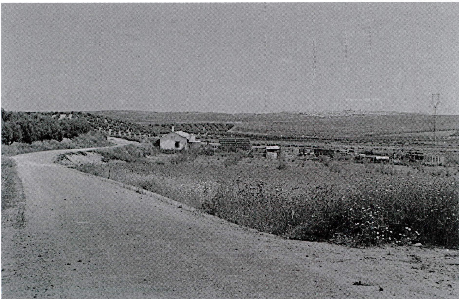
Vereda de Los Moledores. Al fondo la ciudad de Porcuna (Jaén).