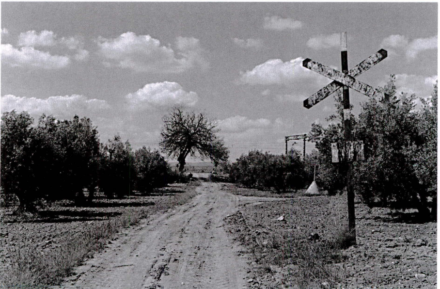
Colada de Lopera al río.