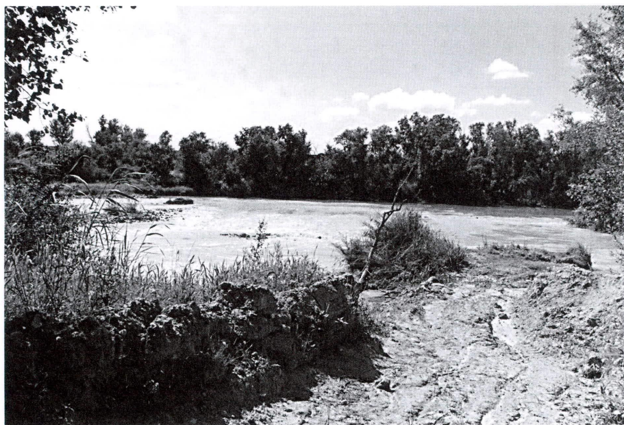
Abrevadero-descansadero Las Puercas.