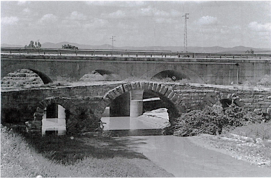
Puente romano de Villa del Río (Córdoba) por el cual pasaba el Cordel del Camino Viejo, uniendo la provincia de Jaén con la de Córdoba.