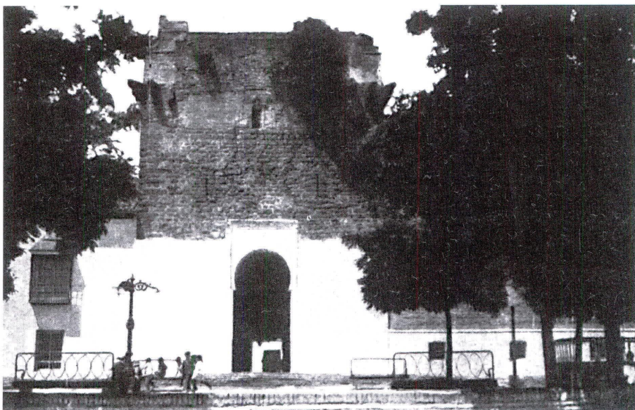
Retrospectiva de la torre del homenaje del castillo de Cañete a comienzos del siglo XX.