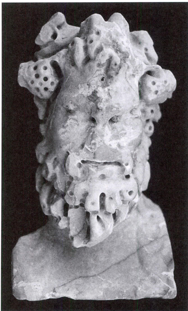
Lámina 1. Busto báquico de Fuente-Tójar (Museo Histórico Municipal de Fuente-Tójar, Córdoba).