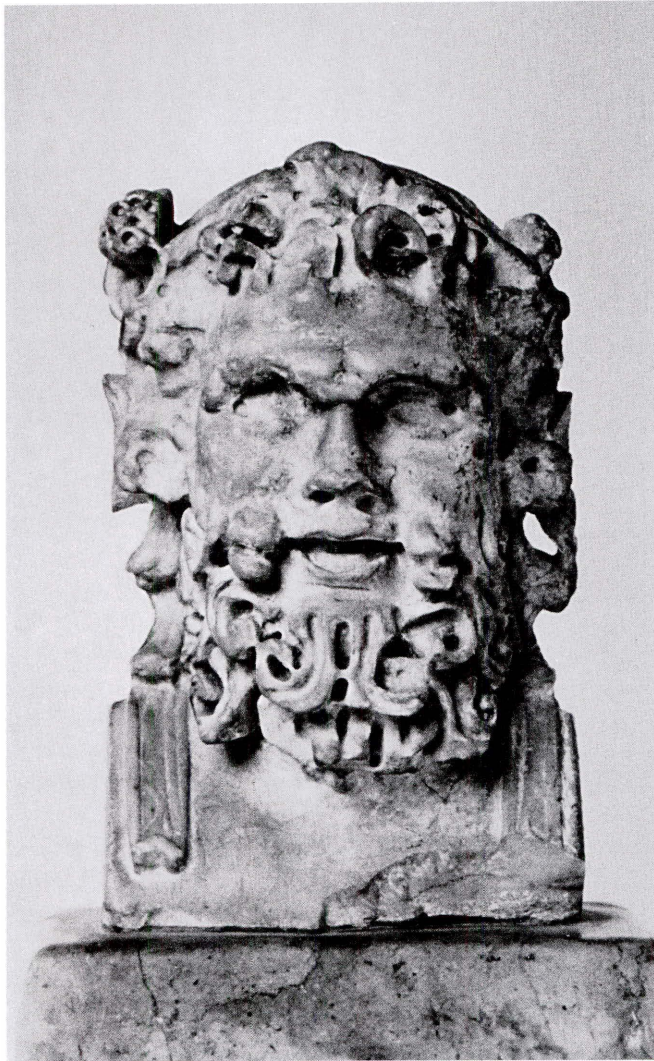
Lámina 3. Busto báquico de Porcuna (Jaén).

Tanto las esculturas cordobesas, como las de Porcuna y de Fuente-Tójar, así como otras imágenes de dioses domésticos, por ser la personificación de una energía, se hallaban presentes en el Lararium , el tablinum , o bien en huertos y jardines. Son Libero, Baco, Sileno, Silvano, Flora, Ceres... quienes, representados en forma humana -en mosaicos y esculturas- 25 presidían y adornaban los huertos, las fuentes y los bosquecillos (p.e., el peristilo de la casa de los Vettios, en Pompeya) protegiendo las cosechas y los ganados de los dueños del lugar, que, agradecidos,