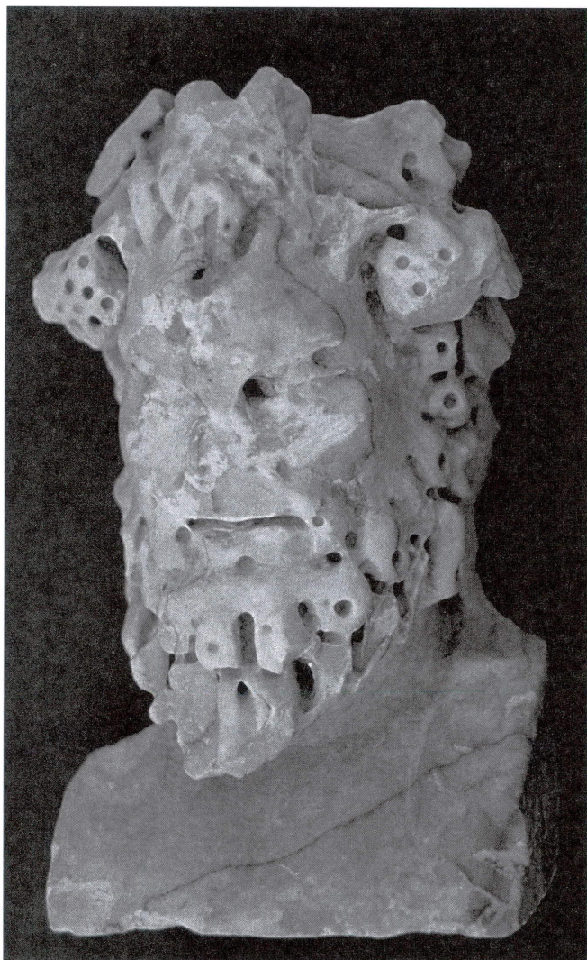
Lámina 2. Herma de Baco (Museo Histórico Municipal de Fuente-Tójar).

procedentes de Nueva Carteya, de origen desconocido y de la calle Cardenal González, respectivamente 23 . Tampoco hemos observado similitud con el herma arcaizante imberbe de Almedinilla, aunque sí con la de Dyonisos (sobre todo en el tratamiento y representación del peinado) aparecidas en la villa de El Ruedo 24 , uilla ligada directamente a Iiturgicola.