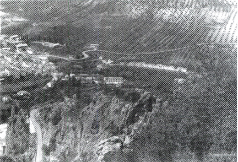
Vista general del barrio Huertas - Isla.