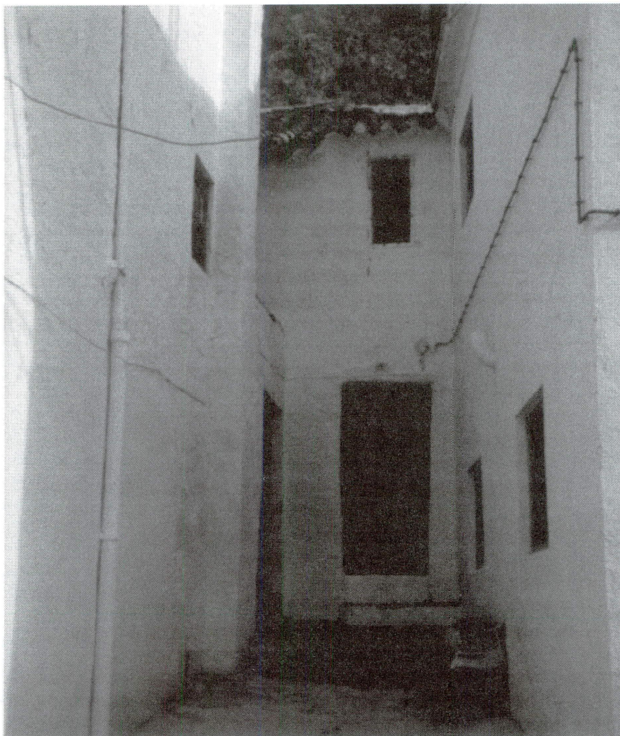
Casa tradicional, sita en la calle Carretera, nº 38. Posiblemente sea la construcción más antigua de la villa, pues está enclavada en la barriada del “Puente” zona donde se recoge, según plano de 1729, edificaciones de características similares.