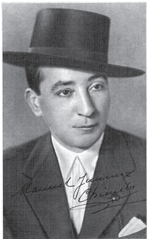
Manuel Jiménez (Chicuelo) toreó 81 corridas en 1928