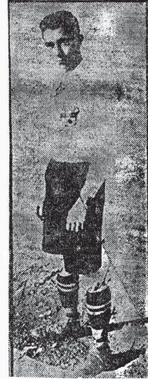
Paco Recio, el futbolista y torero

En este rincón de la provincia de Córdoba, no con el nombre de del Excmo. Señor duque de Veragua, pero sí con la sangre, se lidiaron cuatro novillos, estando a cargo del simpático Recio los dos primeros, en los que vino a demostrar