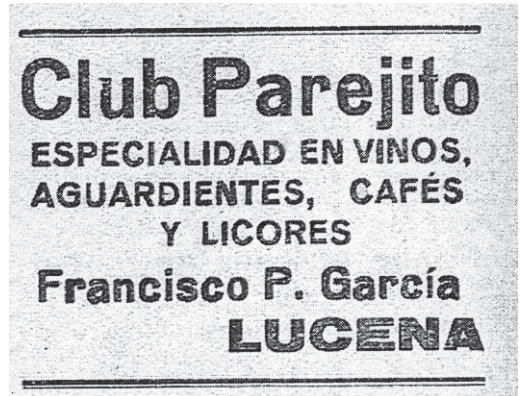
Anuncio del Club Parejito, situado en la calle El Peso

ponían a clavar los palitroques al primer novillo de la tarde –un solemne buey perfectamente ilidiable- el público, el buen público de ayer que batía palmas a cada momento, y por cualquier pretexto o ante el más insignificante de los capotazos, pedía voz en grito fuego para el manso.