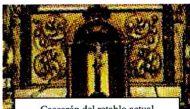
Cascarón del retablo actual

Por bancas tiene unos zoquetes 29 de roble, tan toscos y tan viejos, q e ha sucedido más de una vez llamar tanto la atención del forastero a la entrada q e se le ha olvidado hacer genuflexión al Ss mo Sacram to , pero no es la mayor indecencia la q e en sí tienen, sino la q e ocasionan: no teniendo espaldar es inevitable un diluvio de inmundicias que cubren tres quartas de pared, cuya vista provoca la nausea, tanto como la indignación”.