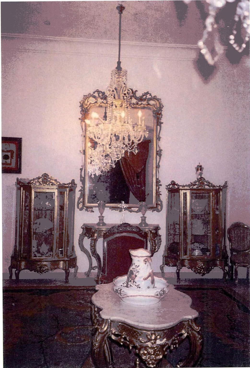
Mayordomía Ducal, salón dorado del palacio.