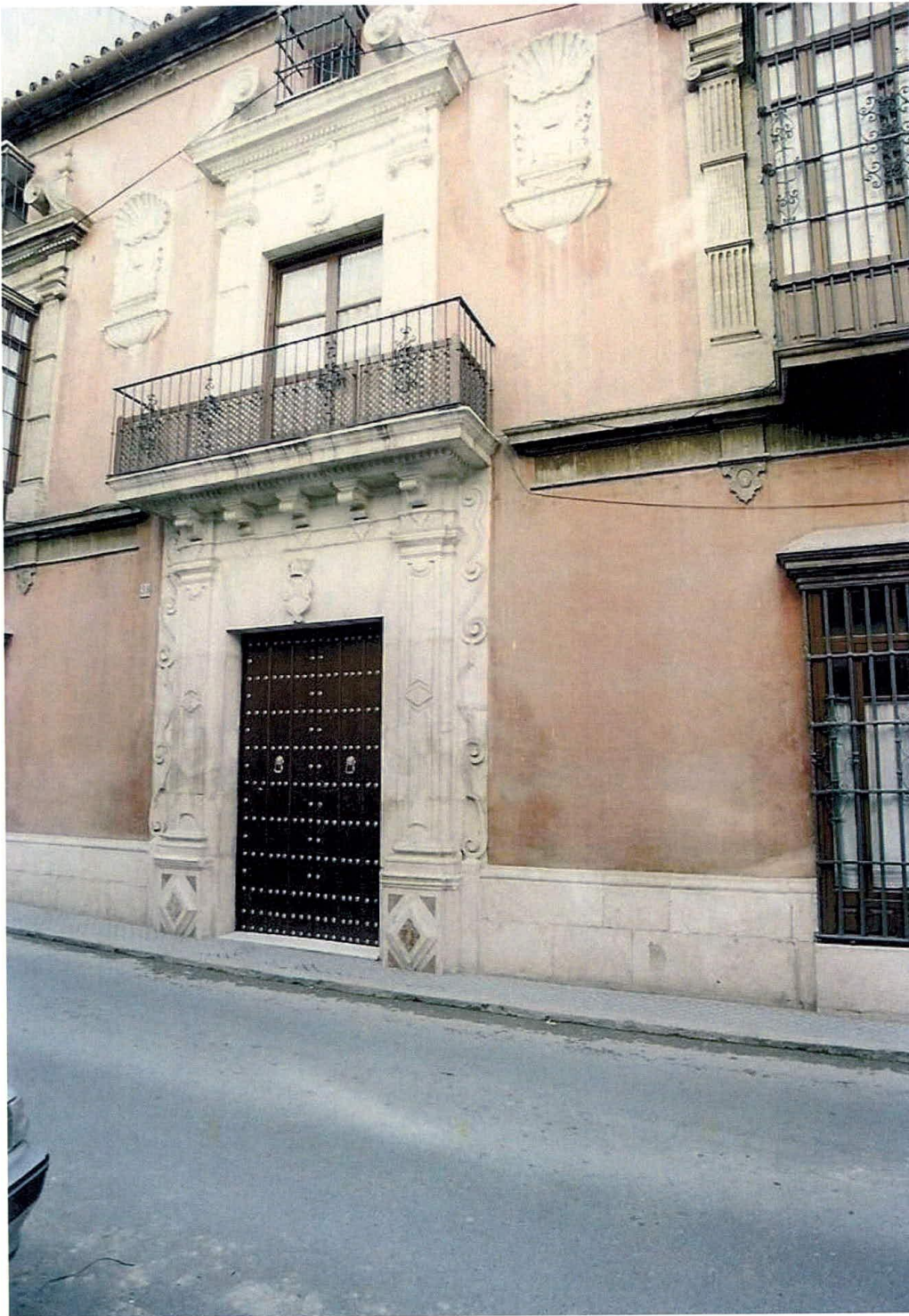
Mayordomía Ducal, fachada.