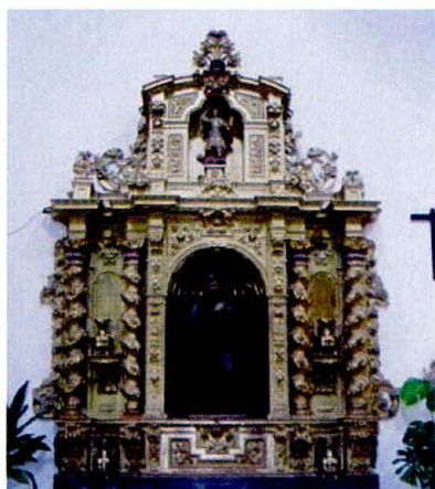
Altar de San Francisco Solano en la iglesia de San Francisco de Priego de Córdoba