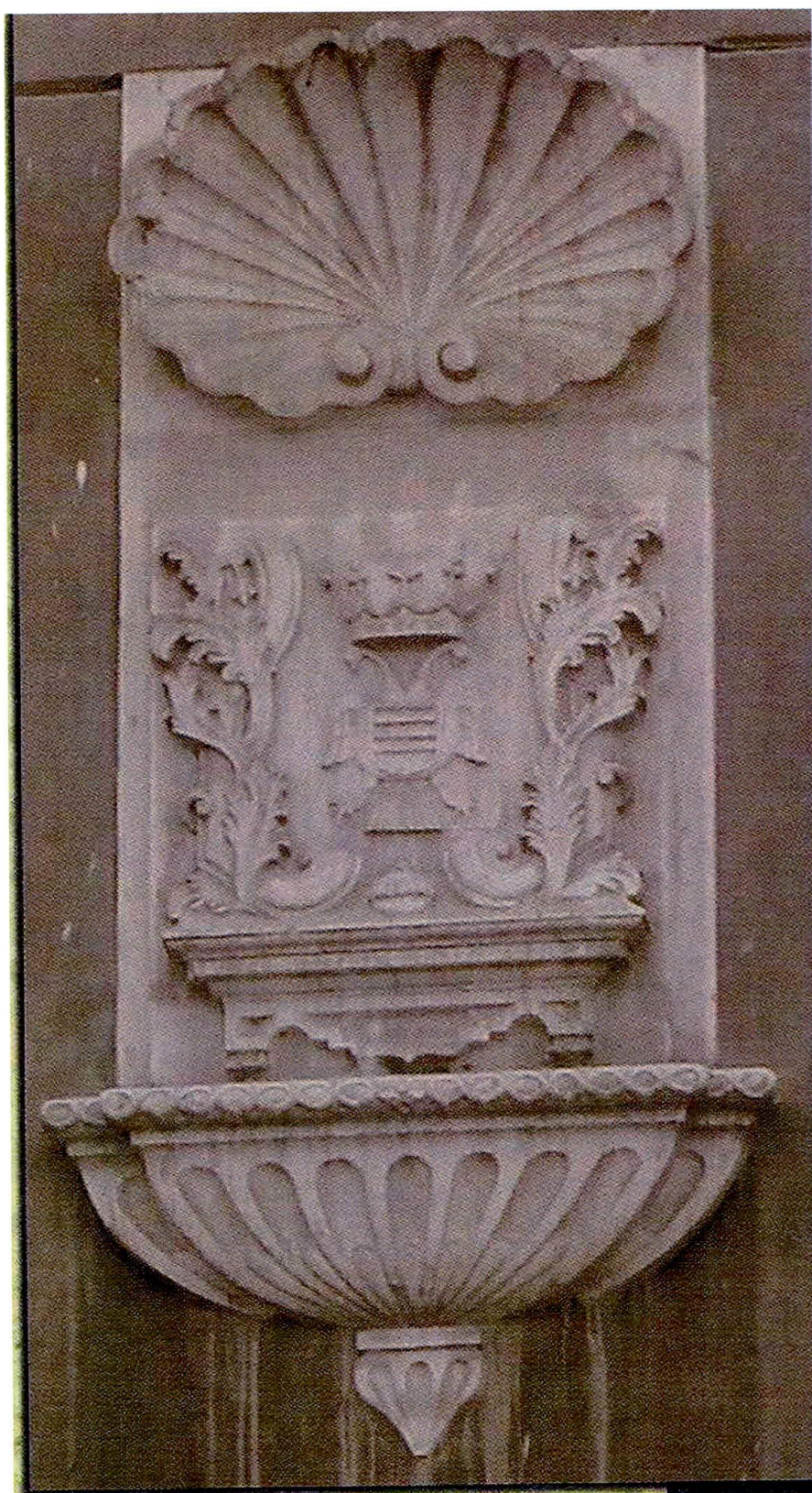
Escudo de la Mayordomía Ducal.