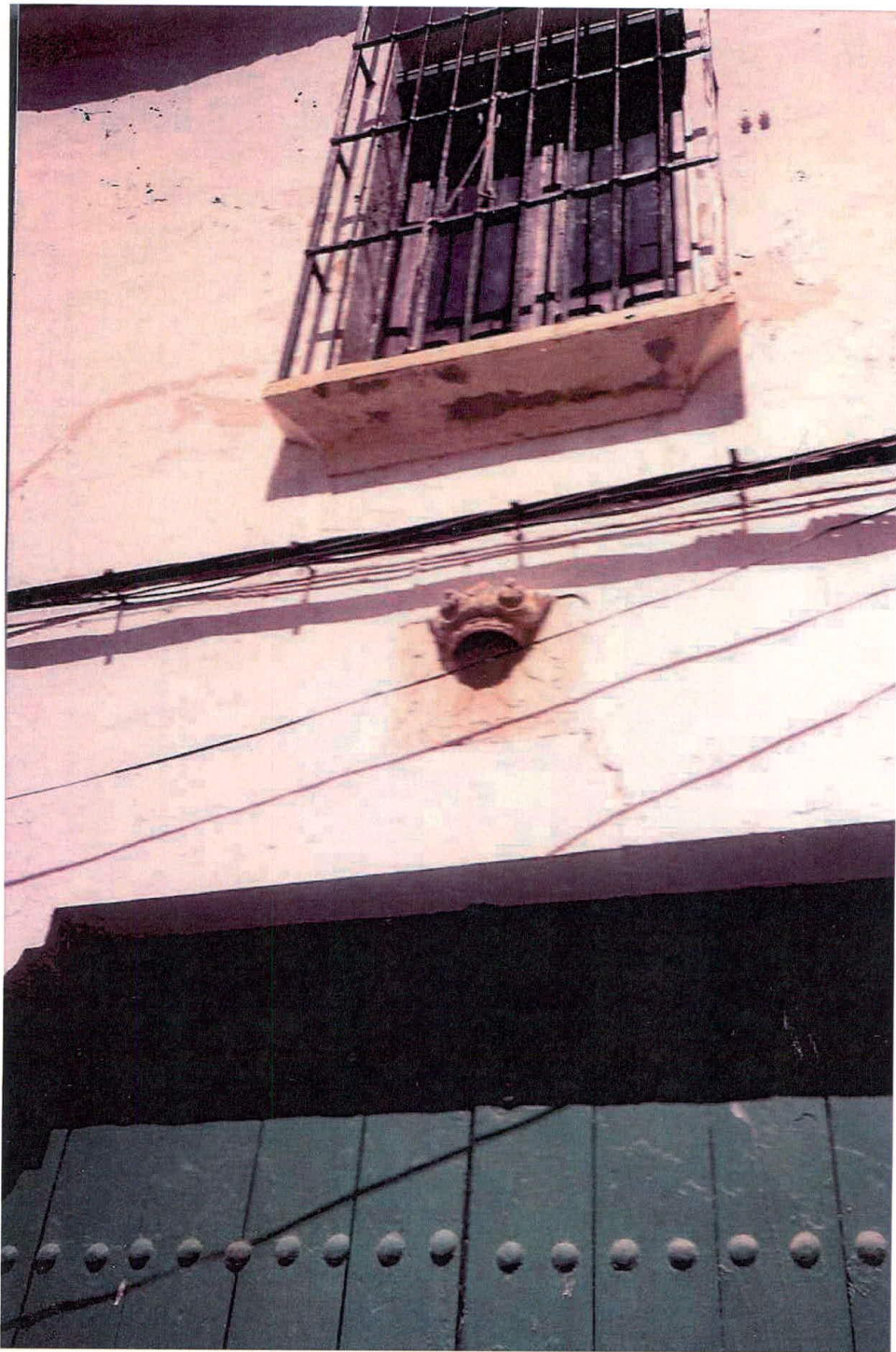
Escudo con anagrama de María de 1787.