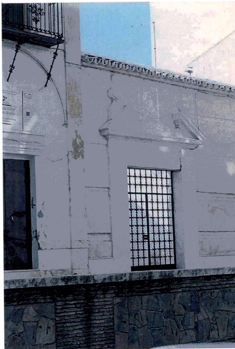
Convento de los Frailes.