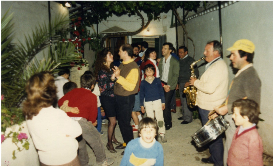
Lám. 12, 1990.