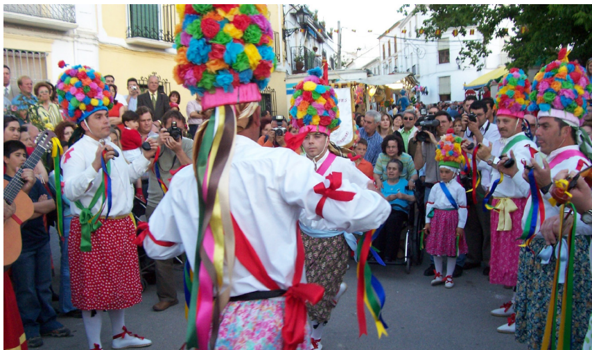
Lám. 56, 2005.