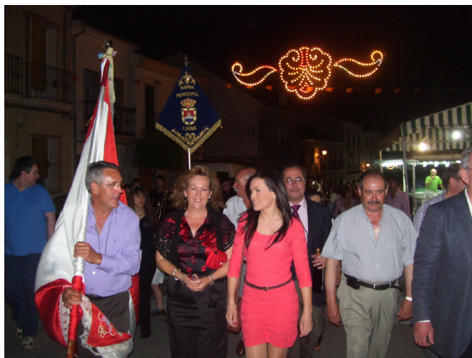
Lám. 18, 2012.