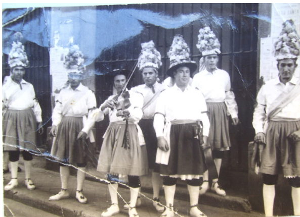
Lám. 29, 1962.