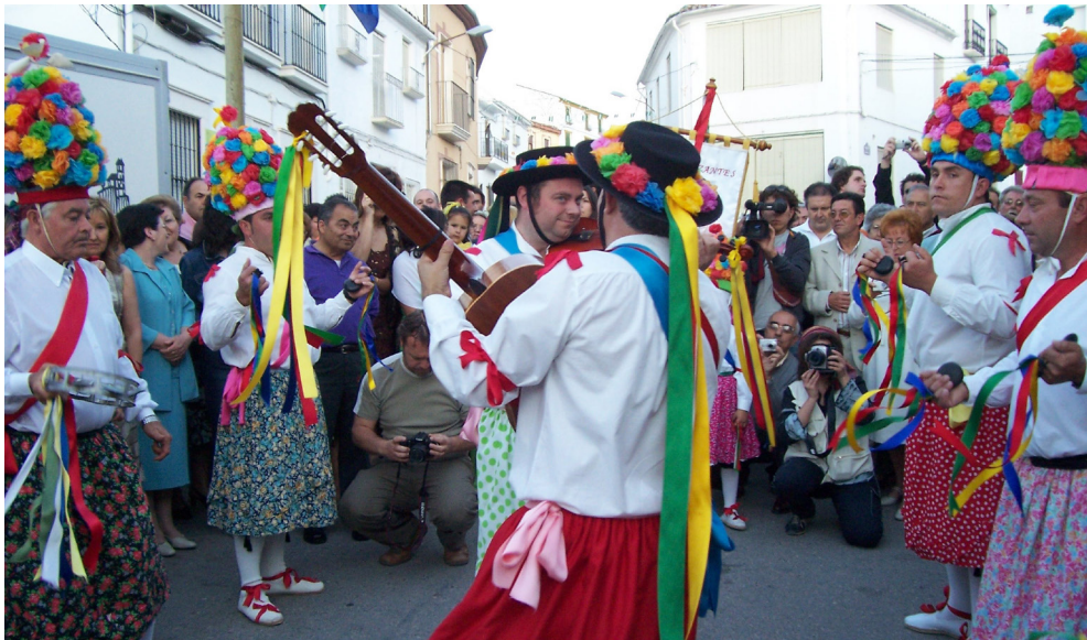
Lám. 44, 2005.