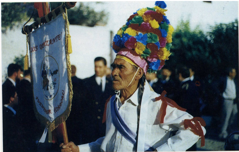
Lám. 90, 1997.