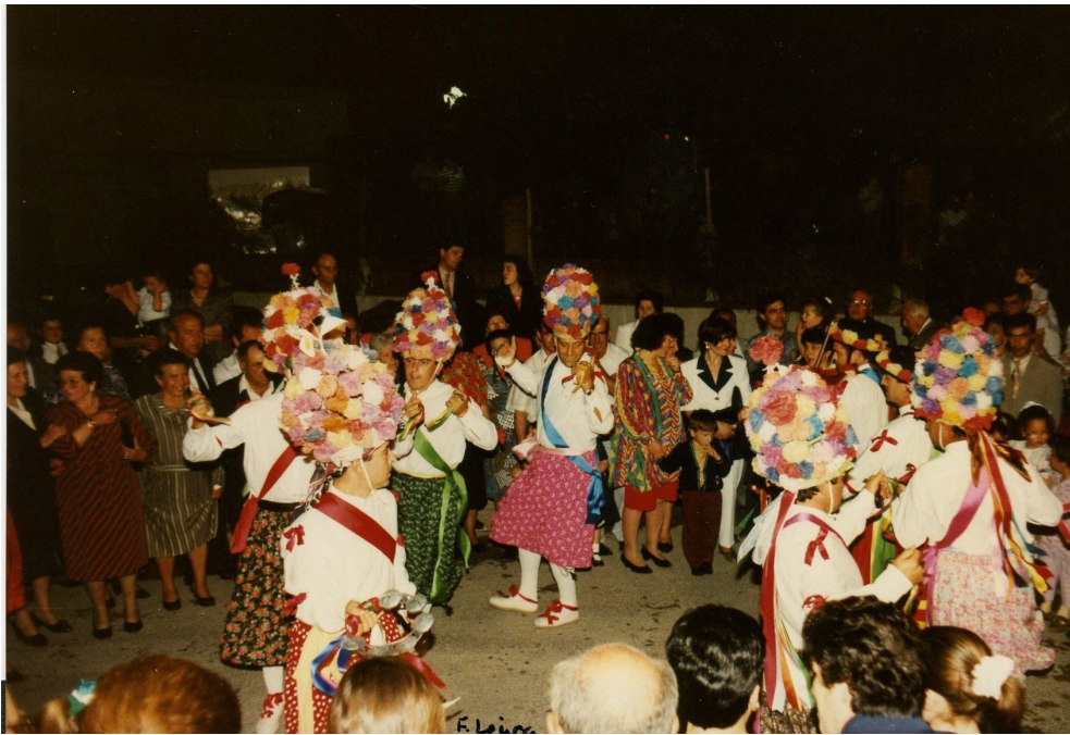
Lám. 67, 1992.