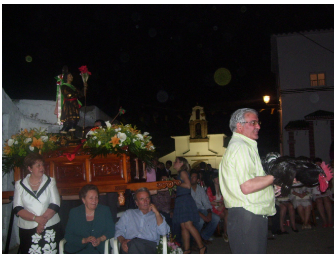
Lám. 86, 2011.