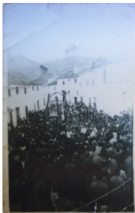
Lám. 24, años 30.