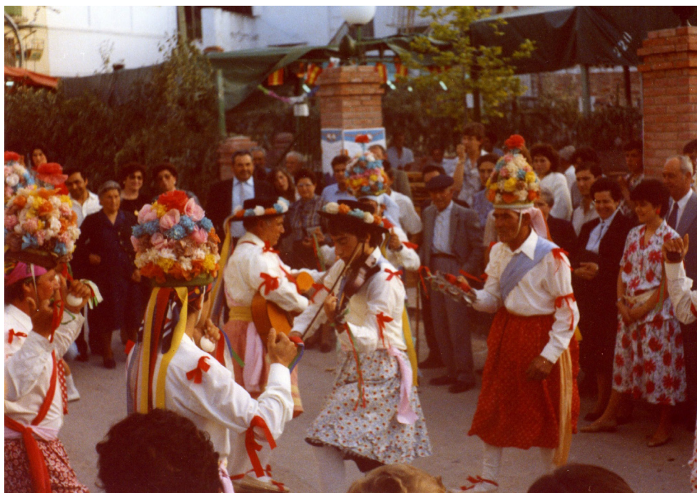
Lám. 54, 1986.