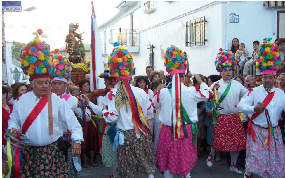
Lám. 65, 2005.