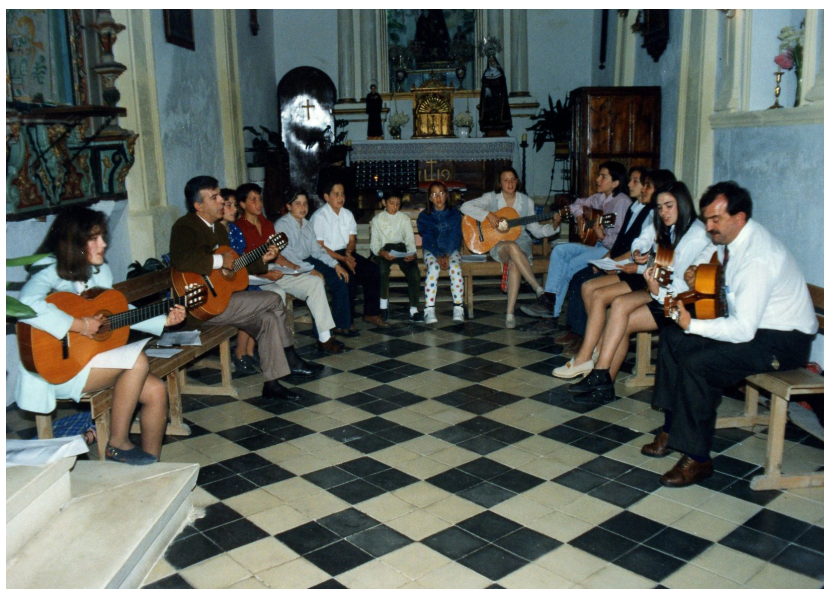
Lám. 20, 1994.