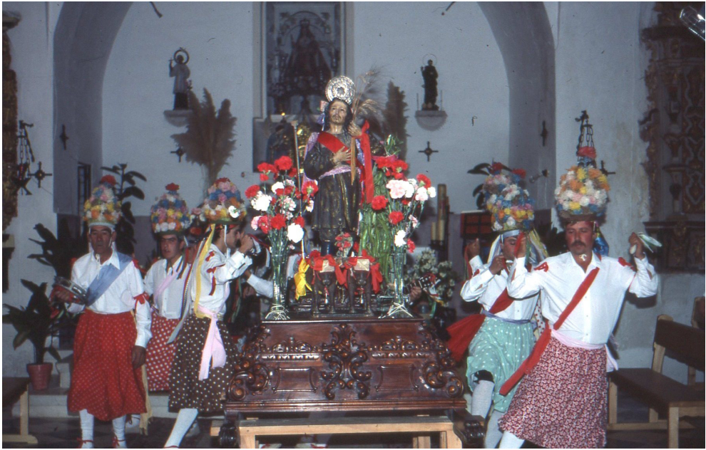
Lám. 2, a la derecha, vista parcial del mismo, 1988.