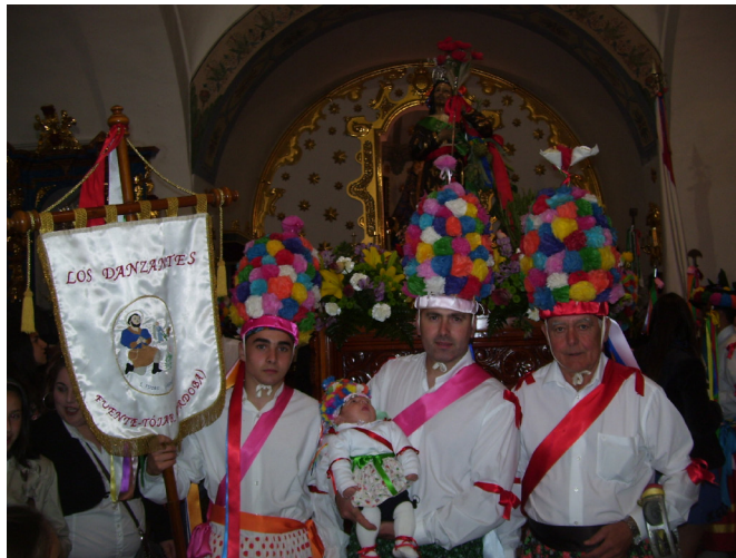
Lám. 78, 2013.