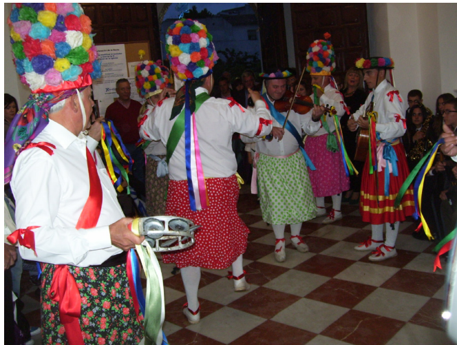
Lám. 42, 2013.