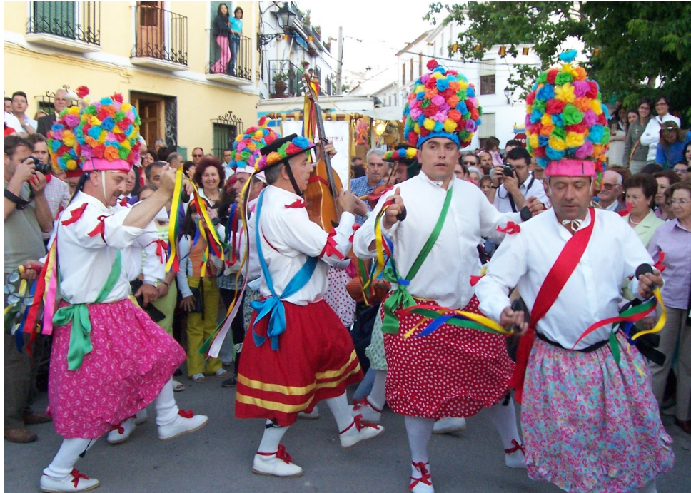
Lám. 62, 2005.