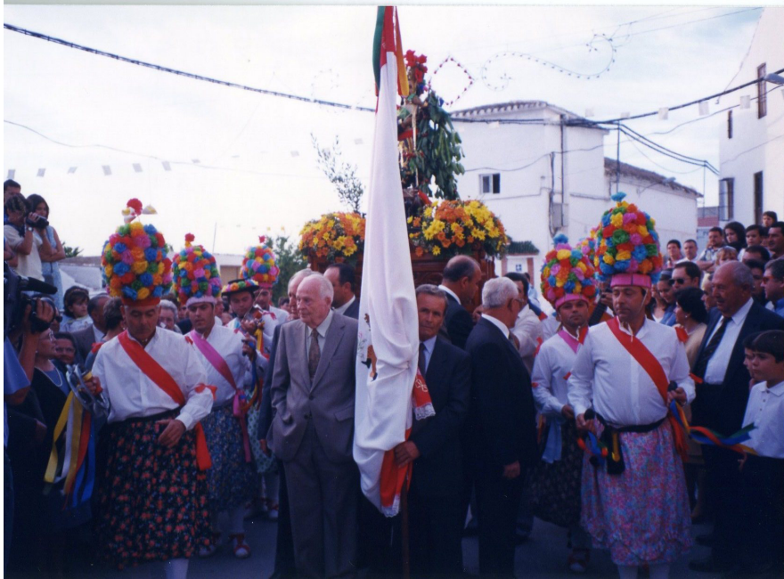
Lám. 63, 1999.