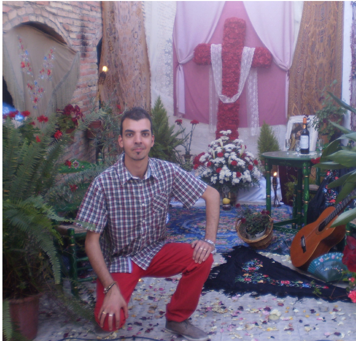
Lám. 13, 2011.