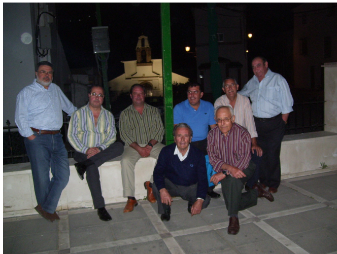
Lám. 7, 2013.