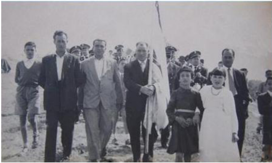
Lám. 8, entre 1945-1960.