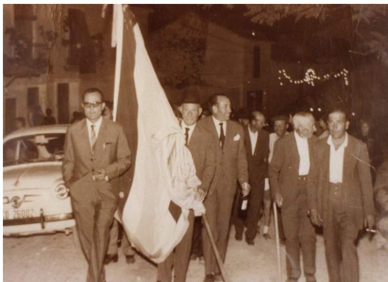
Lám. 9, años 70.