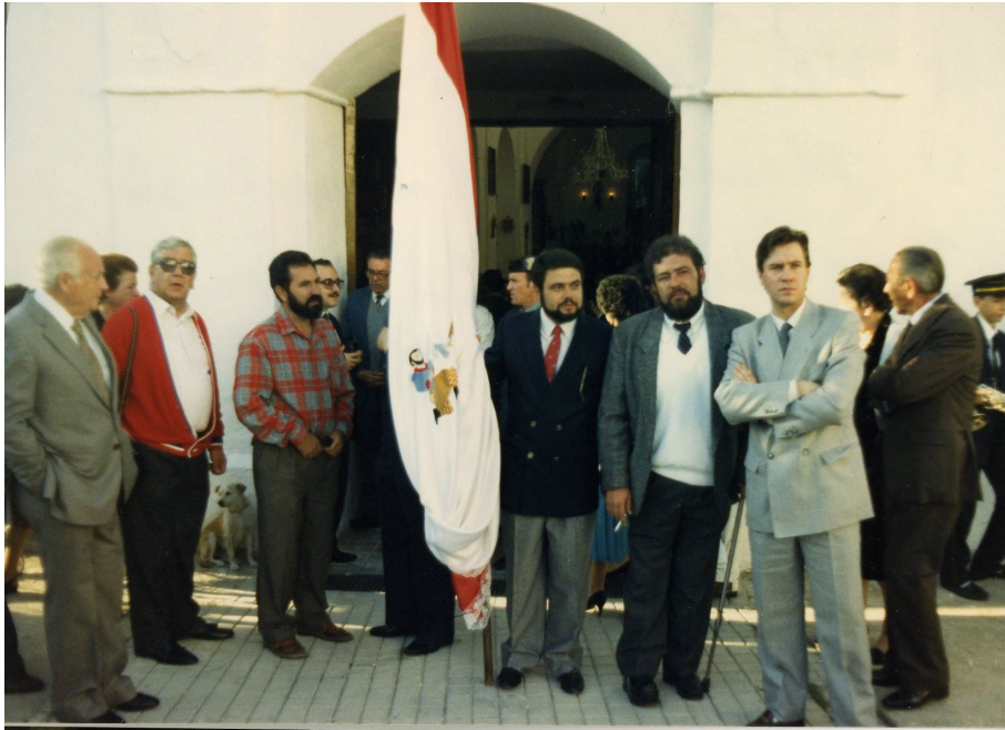
Lám. 51, 1988.