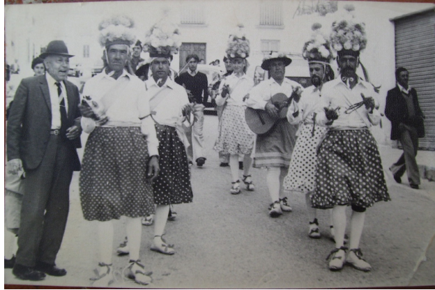
Lám. 35, 1980.