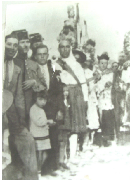
Lám. 26, años 30.