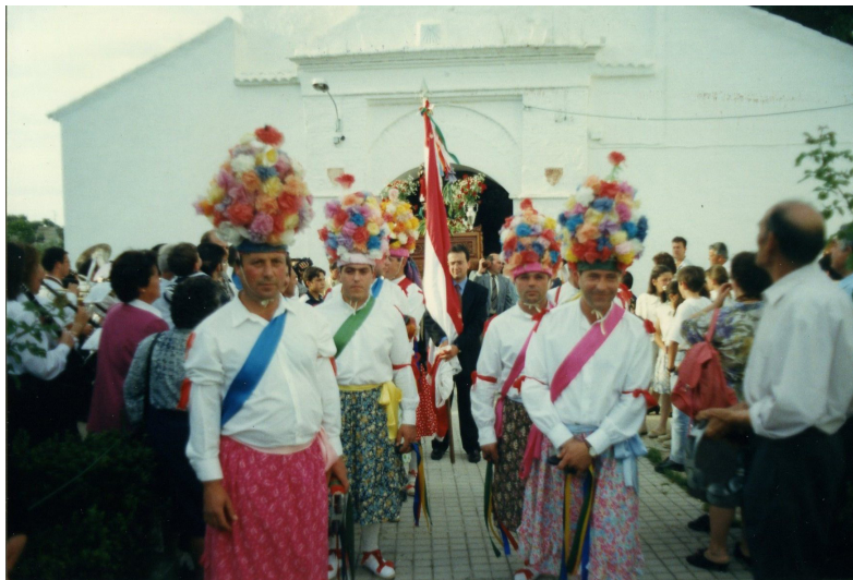
Lám. 17, 1995.