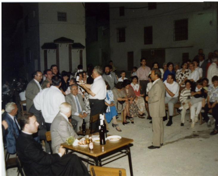
Lám. 85, 1990.