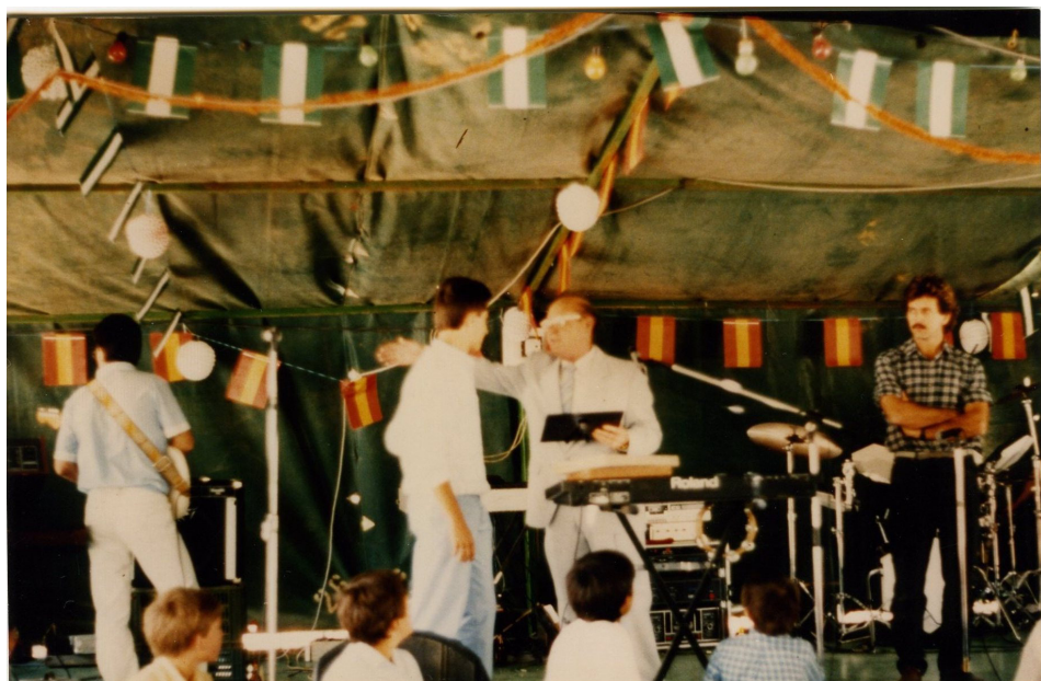
Lám. 92, 1987.