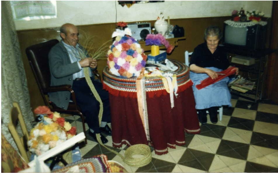
Lám. 45, 1988.