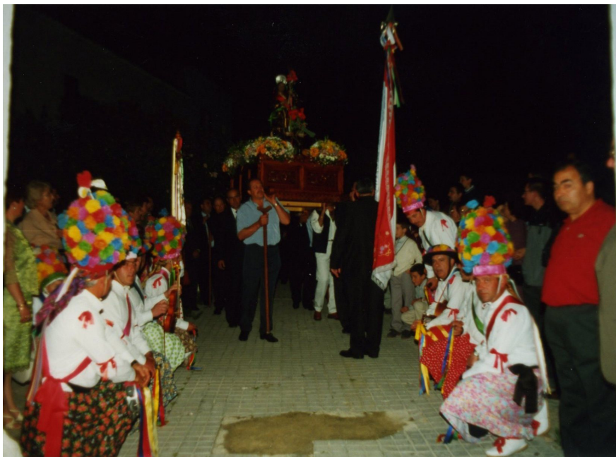
Lám. 68, 1996.