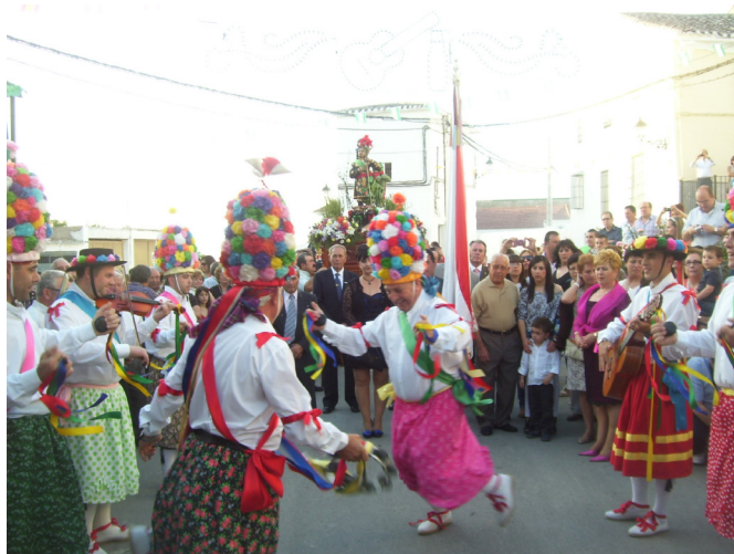
Lám. 55, 2012.