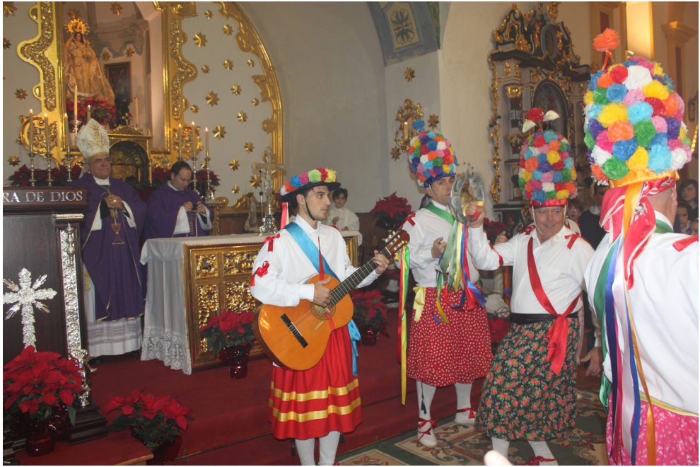
Lám. 41, 2013.