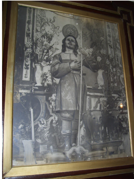
Lám. 4, década de los “30”.