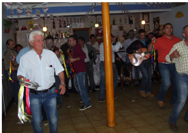
Lám. 74, 2013.

Sirva este trabajo como HOMENAJE a todas las personas e Instituciones que han sabido conservar, transmitir y hacer grandes la Danza y Fiesta de San Isidro de Fuente-Tójar, mi pueblo, al que le dedico, una vez más, el siguiente