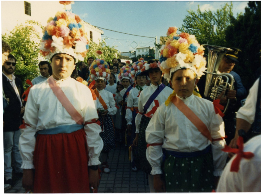
Lám. 37, 1988.