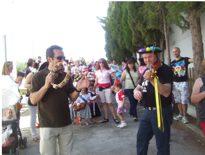
Lám. 81, 2012.