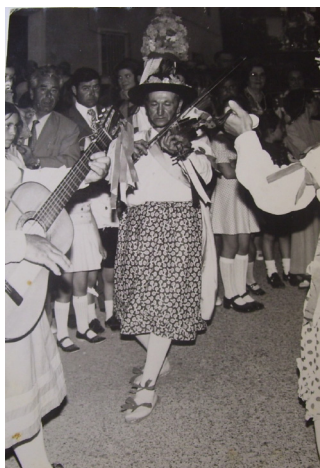
Lám. 88, 1974.