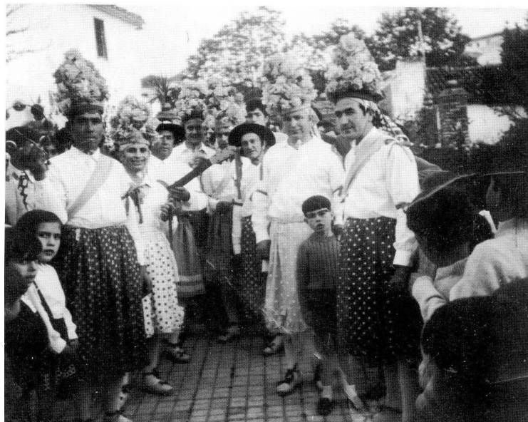
Lám. 31, 1964.