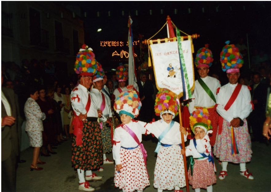
Lám. 46, 2001.