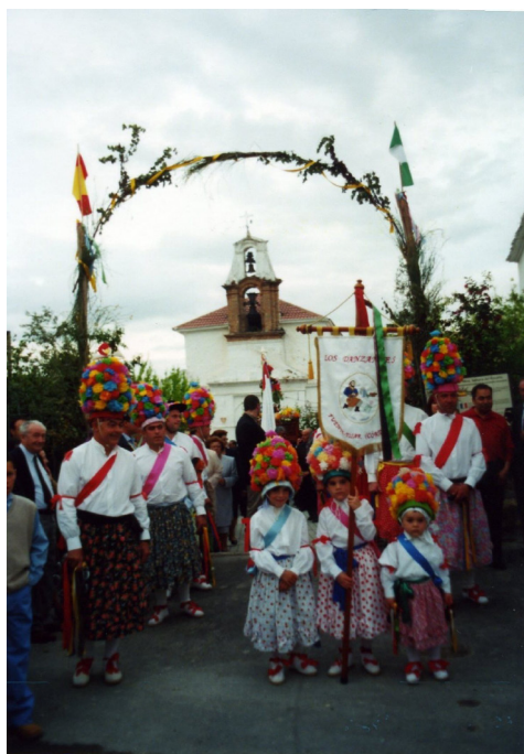
Lám. 14, 2001.