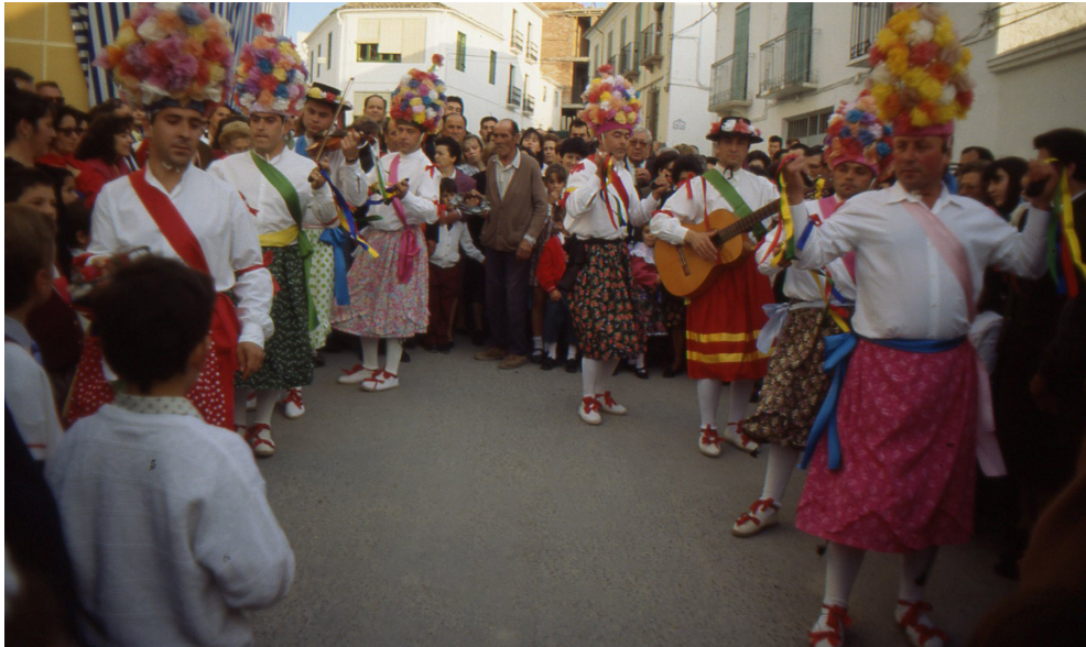
Lám. 61, 1993.