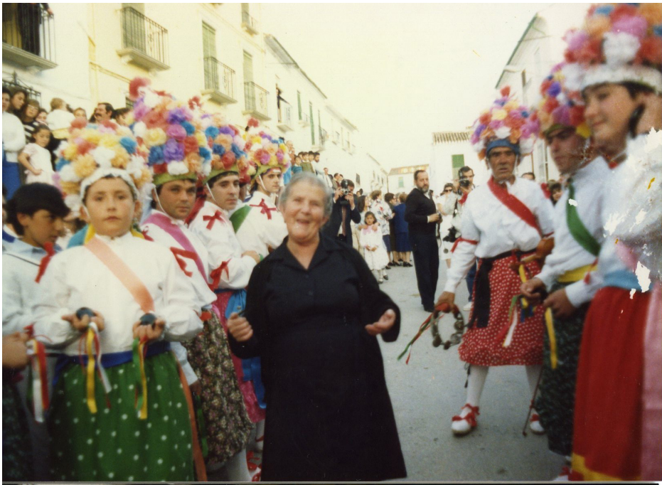
Lám. 36, 1988.