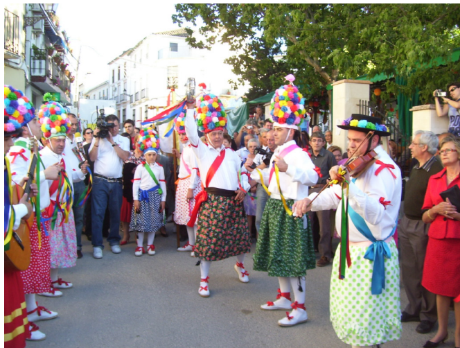
Lám. 64, 2009.