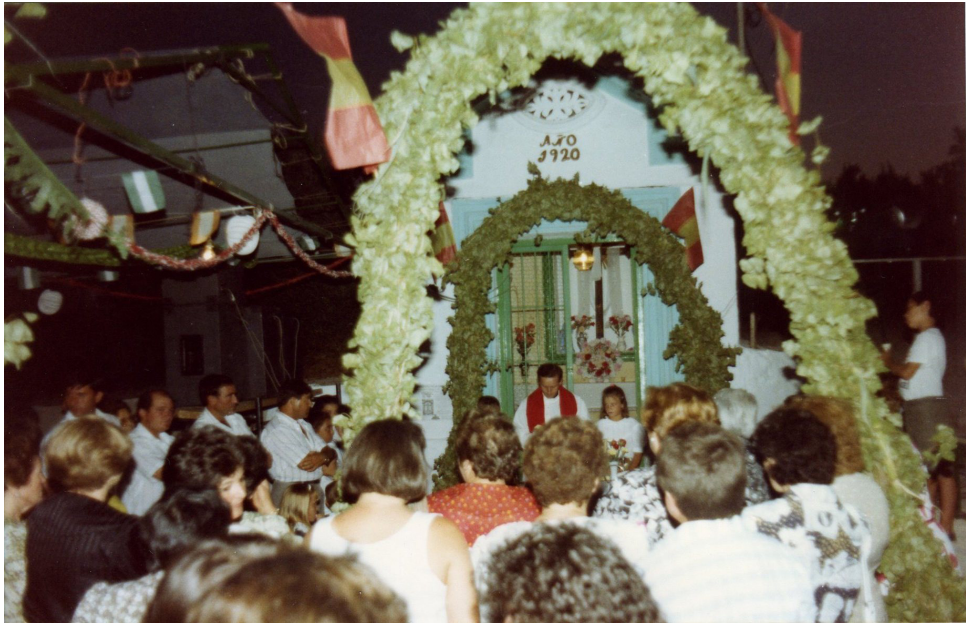
Lám. 11, 1990.