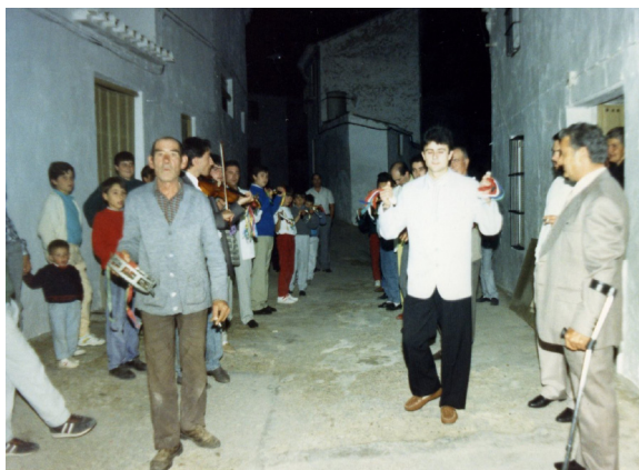
Lám. 72, 1988.