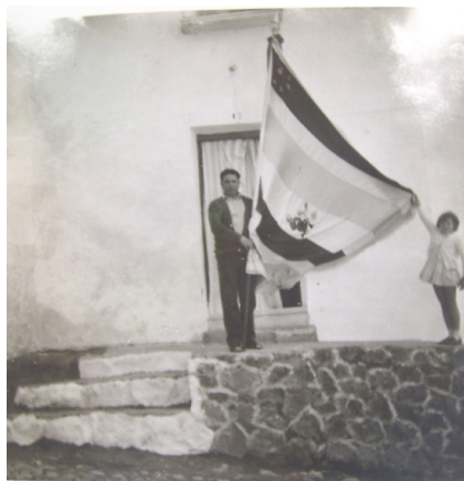
Lám. 79, ¿principios de la década de los 60?