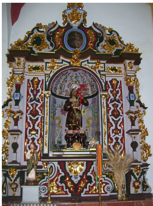
Lám. 1, 2013.