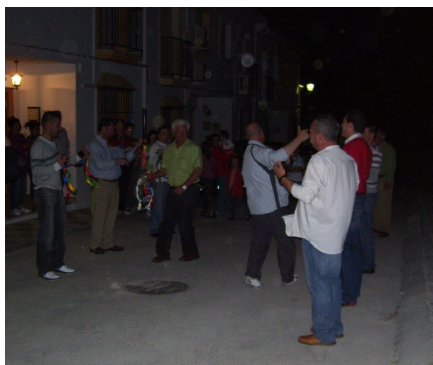
Lám. 73, 2009.