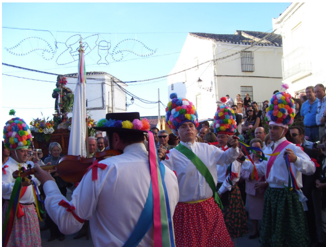
Lám. 58, 2009.