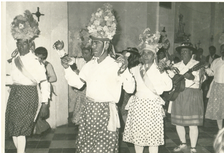
Lám. 32, 1974.