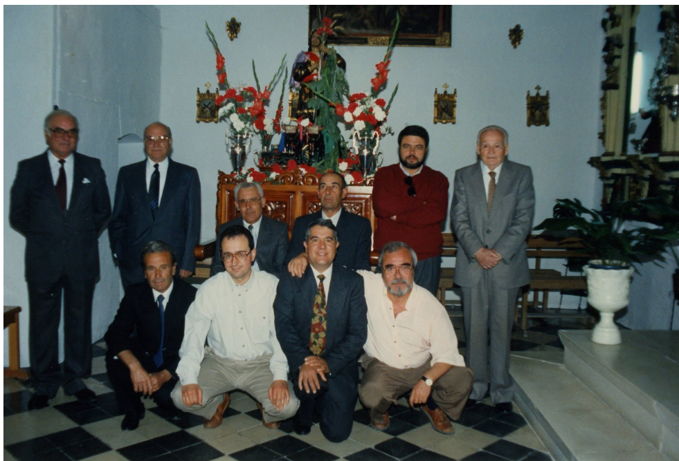
Lám. 10, 1994.