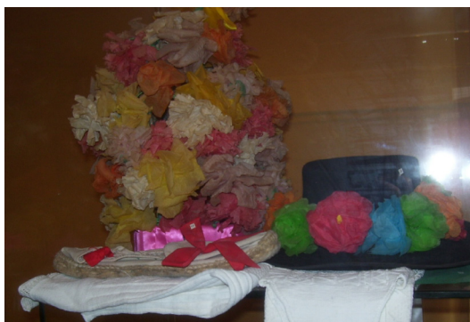
Lám. 22, 2012.