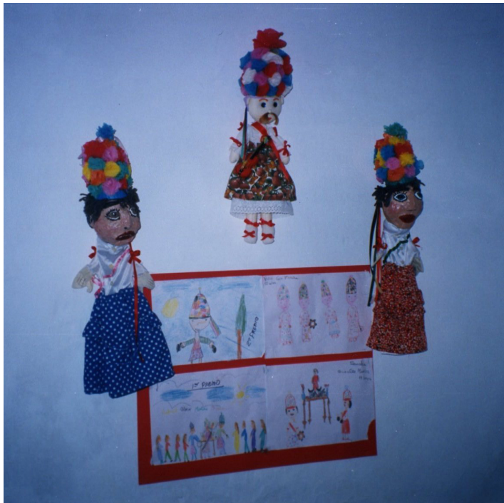
Lám. 84, 1998.