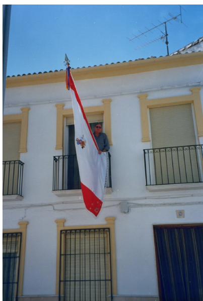
Lám. 70, 2000.