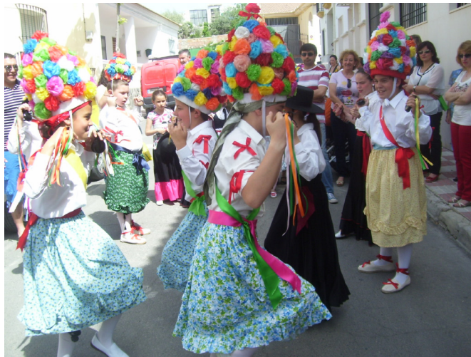
Lám. 82, 2012.