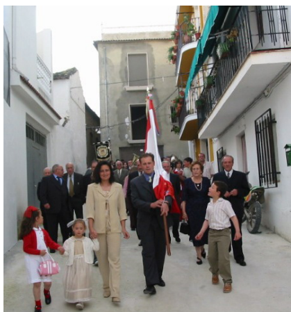
Lám. 71, 2004.