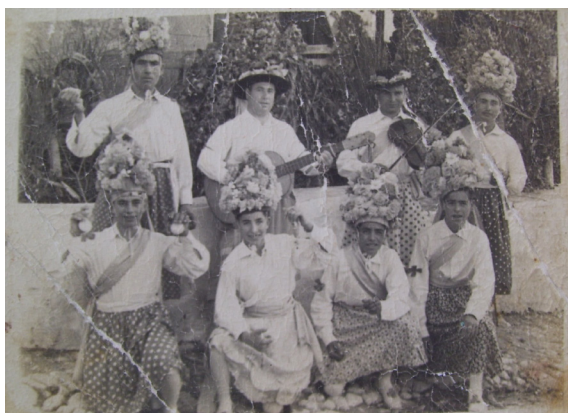
Lám 27, años 50.