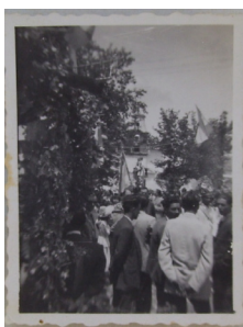
Lám. 23 años 30.