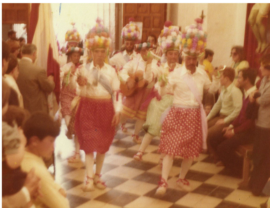
Lám. 34, 1977.