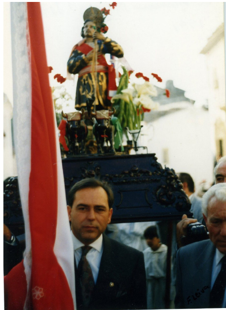
Lám. 52, 1991.