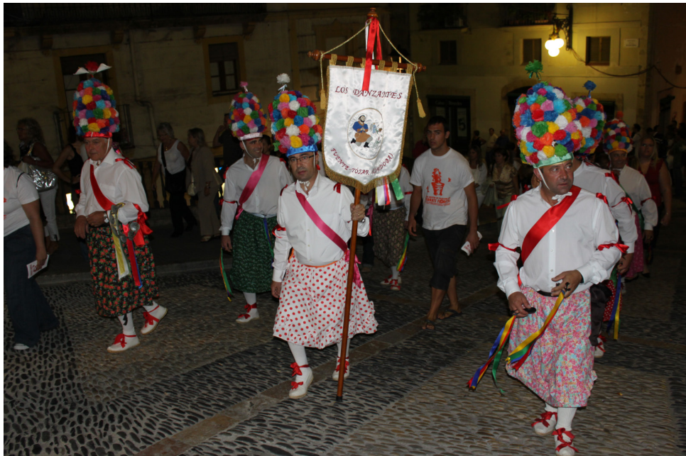
Lám. 38, 2009.