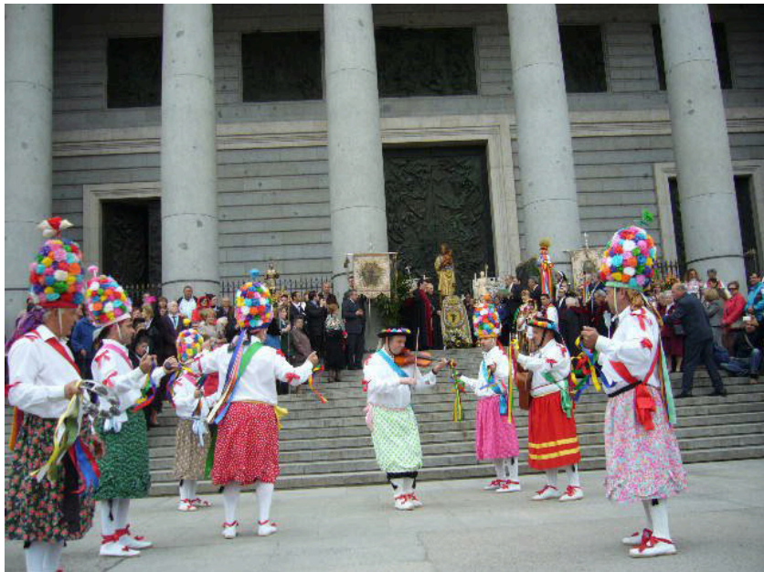
Lám. 40, 2011.