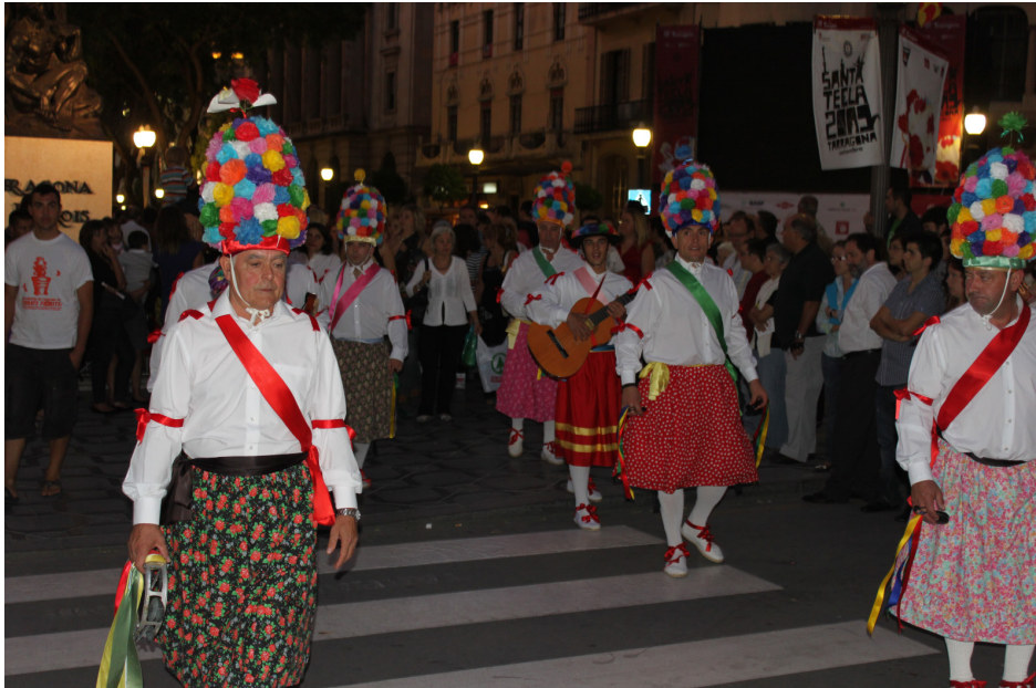
Lám. 39, 2009.