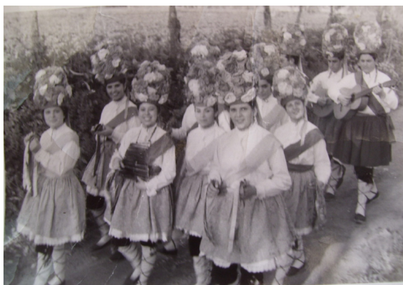
Lám. 28, años 50.