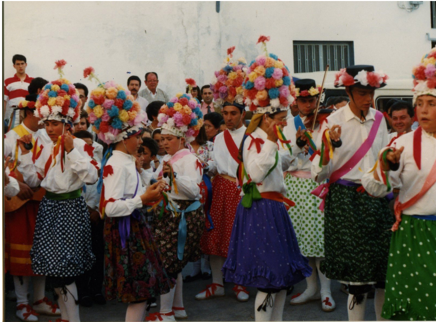
Lám. 80, 1991.