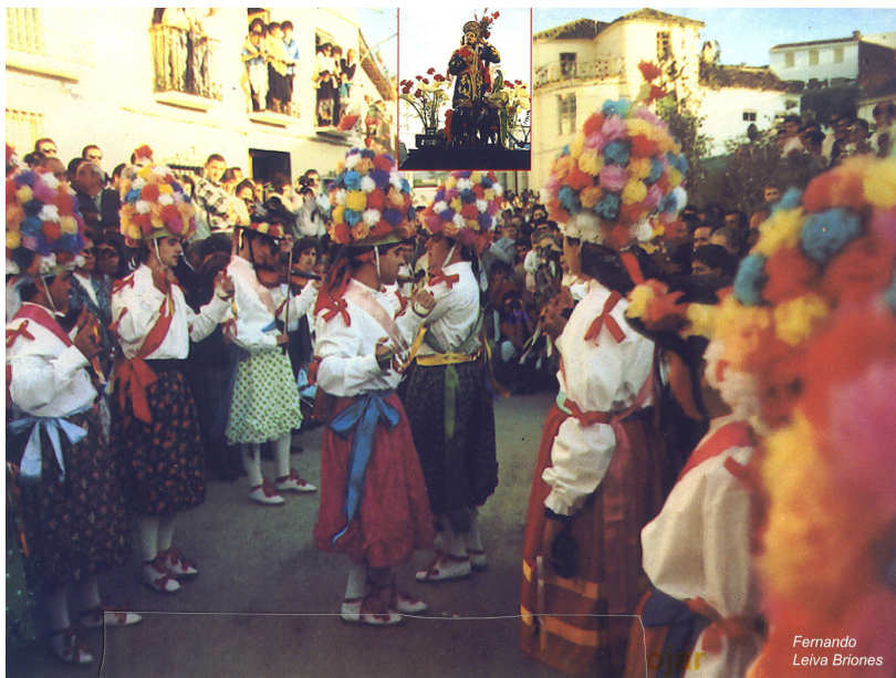
Lám. 48, 1988.