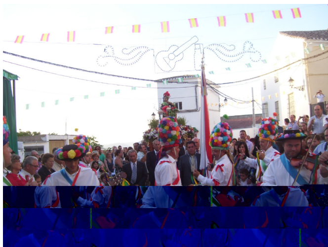
Lám. 53, 2012.