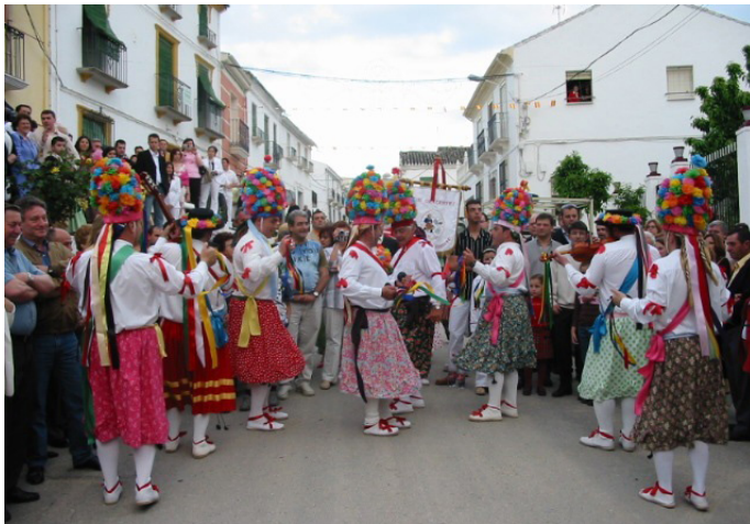
Lám. 60, 2008.