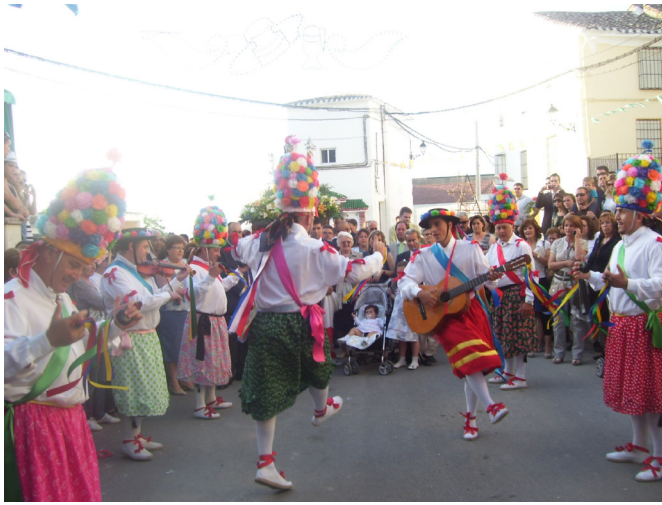
Lám. 57, 2011.