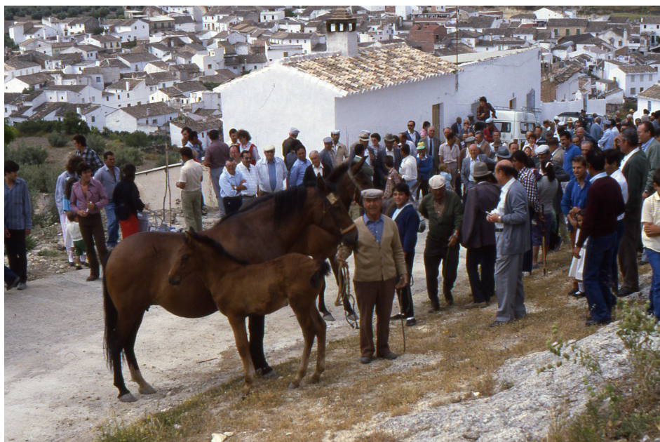
Lám. 19, 1987.