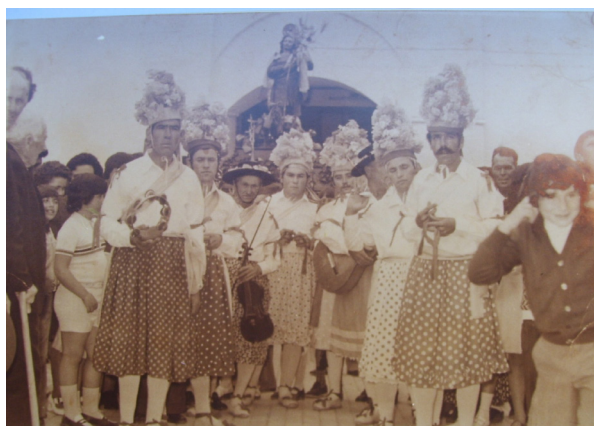
Lám. 33, 1975.