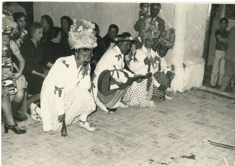
Lám. 75, 1974.