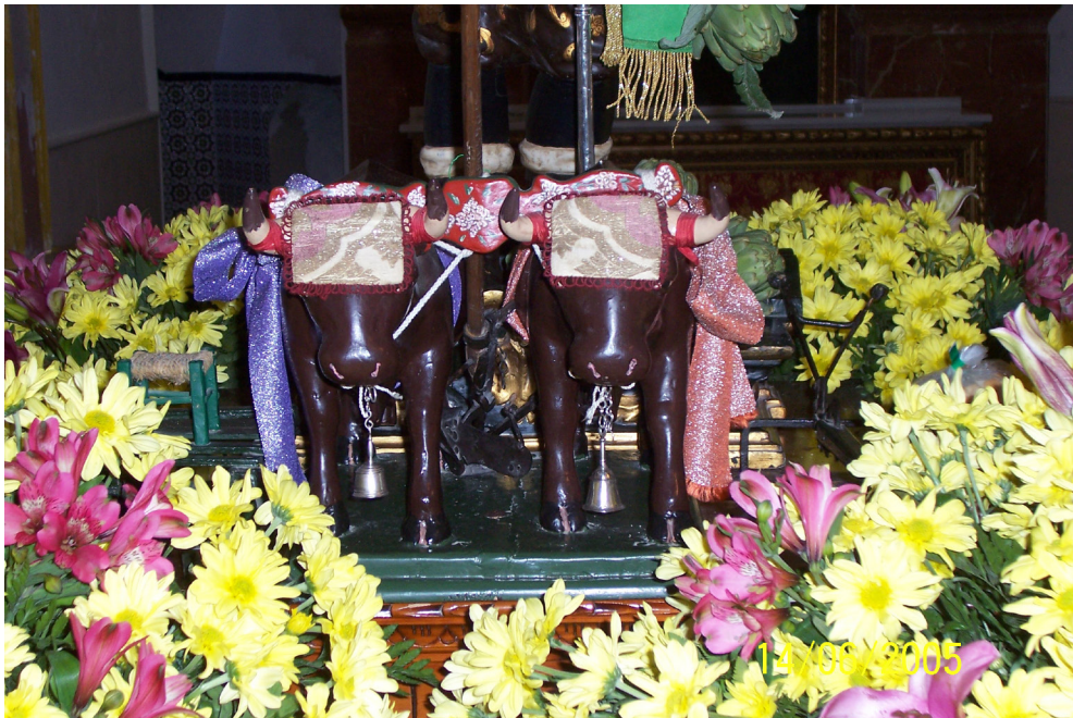
Lám. 5, 2012.