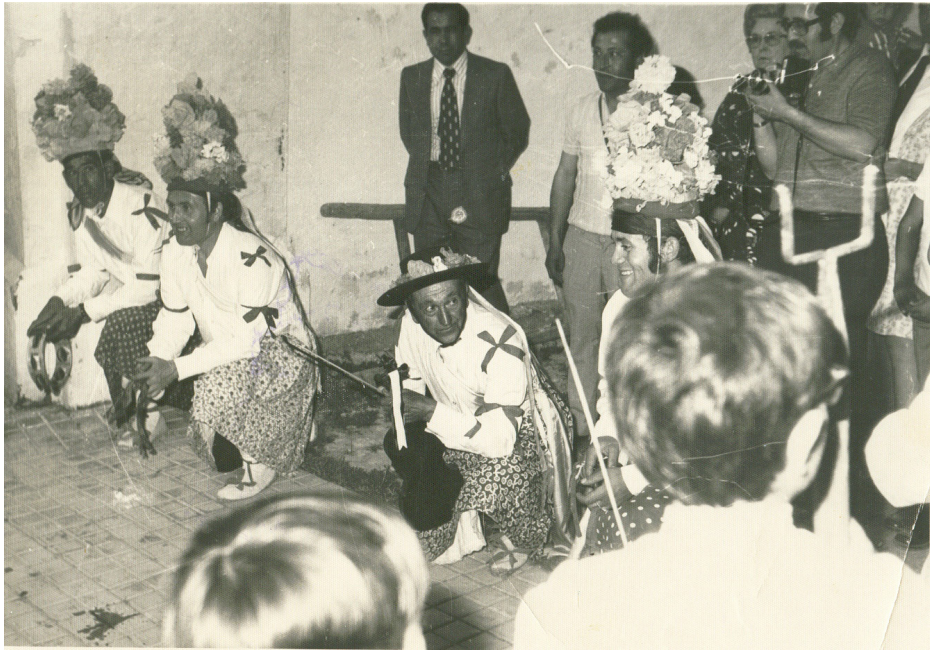
Lám. 25, 1974.