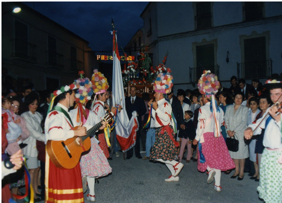
Lám. 66, 1993.