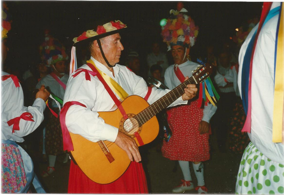
Lám. 89, 1991.