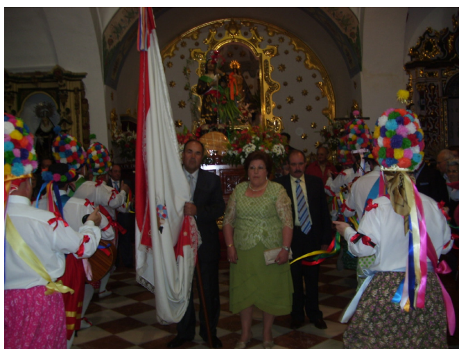
Lám. 50, 2010.