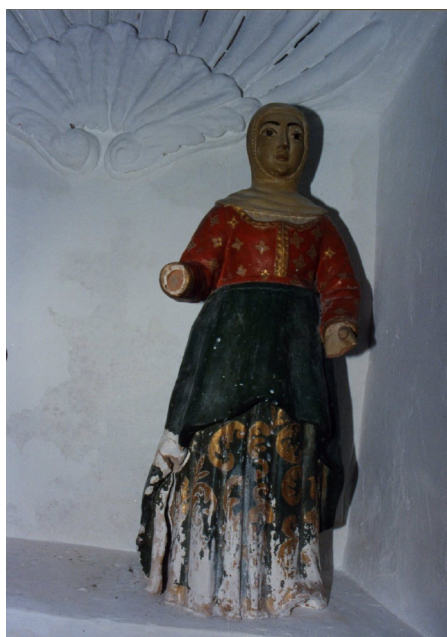
Lám. 15, 1990.