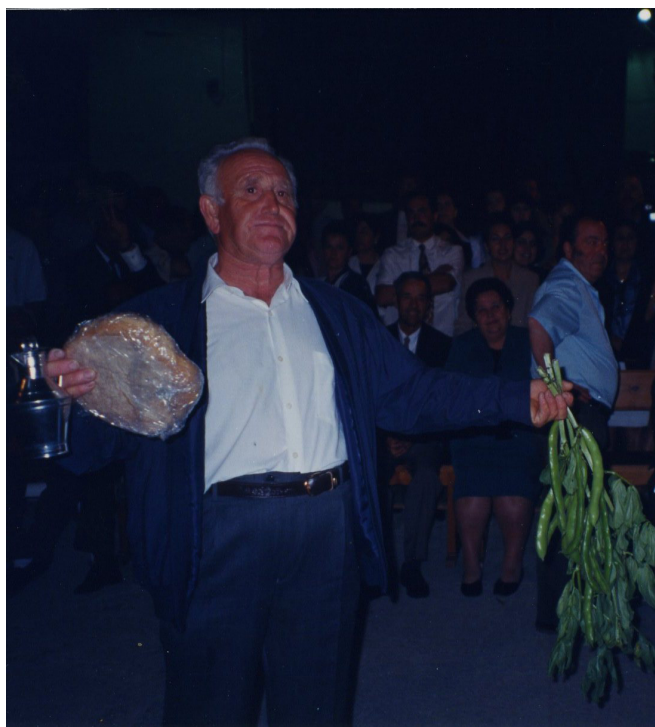
Lám. 21, 1999.