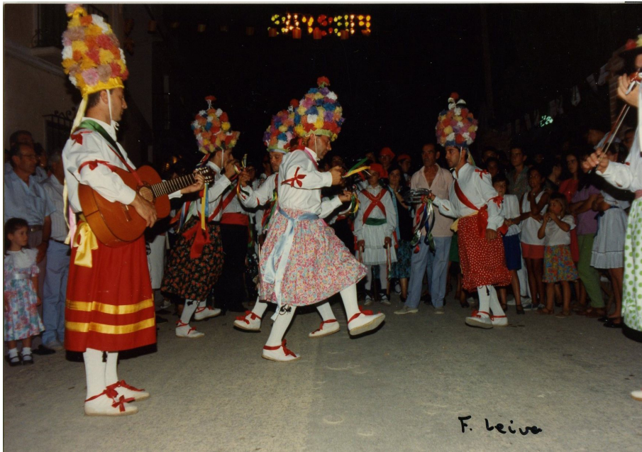
Lám. 47, 1992.