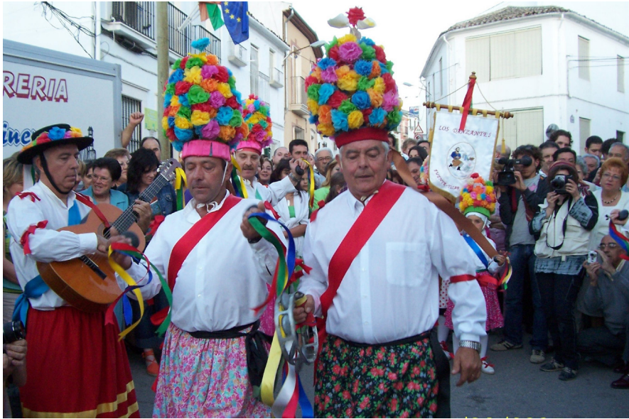
Lám. 59, 2005.