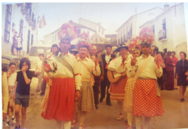
Lám. 49, 1974.