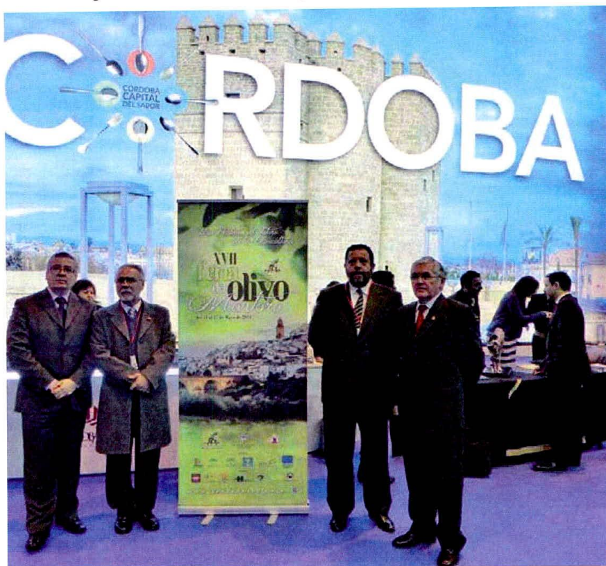
Cartel anunciador de la XVII Feria, presentado en Fitur.

sociedad quedó constituida con la denominación Ilígora en clara referencia a un supuesto nombre que tuvo de Montoro en época prerromana.