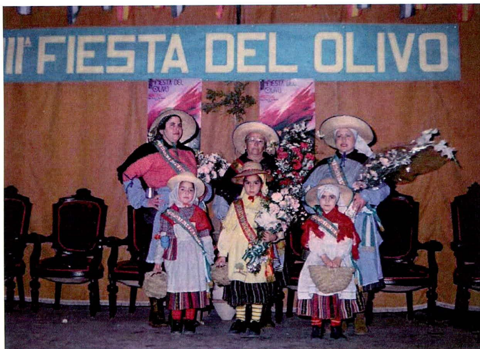
III Fiesta del Olivo: Aceituneras “mayor” y damas.

Una de los actos con mayor sabor y tipismo de la Feria fue, sin duda, la elección de “Aceitunera mayor y Damas”, cuyo principal objetivo era rescatar del olvido el atuendo y vestimenta que las aceituneras usaban antiguamente en la recogida de la aceituna.